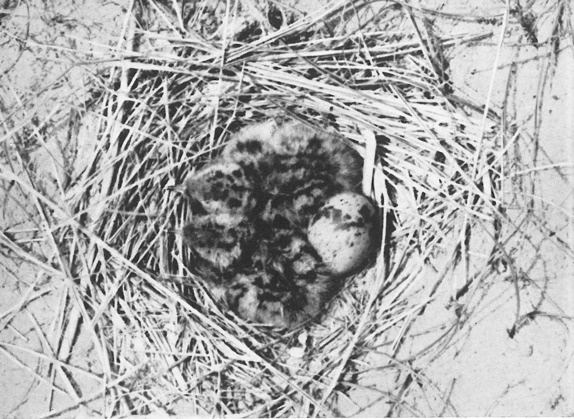
50 — Sterna hirundo 51 — „Hofstade”