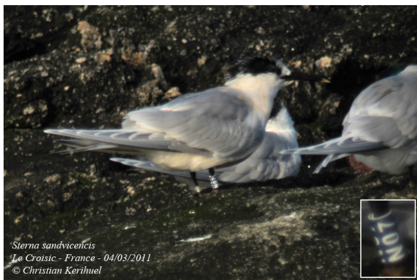
Figuur 8 Grote Stern N07 op 04-03-2011 in Le Croisic, Frankrijk Sandwich Tern N07 on 04-03-2011 in Le Croisic, France.