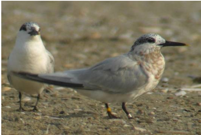
Figuur 3 Grote Stern 0-240 gezien op 07-08-2009 en 23-08-2009 op de het strand nabij de Pier van IJmuiden. Sandwich Tern 0-240 seen on 07-08-2009 and 23-08-2009 on the beach near the Pier van IJmuiden.

← Figuur 2 Cumulatieve kaart (periode 19 mei - 29 juni) met daarop de positiebepalingen van vogel 0-247 (vogel met mislukt broedsel, 19 mei gezenderd, begin juni broedsel verlaten), bepaald vanuit het vliegtuig. Inzet is een foto van de vogel, gemaakt vanuit het vliegtuig, zittend op een zandplaat op 15-06-2009. Cumulative map (period 19 May - 29 June) with locations of Sandwich Tern 0-247 (failed breeder, tagged on 19 May, left colony start of June) detected from an airplane. Set-in is a photograph taken from the survey plane of the bird sitting on a sandy plate on 15-06-2009.