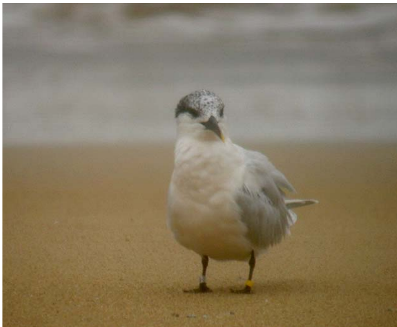
Figuur 5 Grote Stern op het strand van Saint Laurent-sur-Mer (Normandië, Frankrijk) op 20-11-2009. Sandwich Tern on the beach of Saint-Laurent-sur-Mer (Normandy, France) on 20-11-2009.