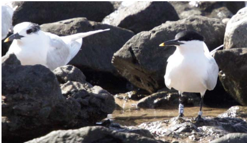
Figuur 7 Grote Stern N22 op 01-03-2011 op Lanzarote, Canarische Eilanden. Sandwich Tern N22 on 01-03-2011 at Lanzarote, Canary Islands.