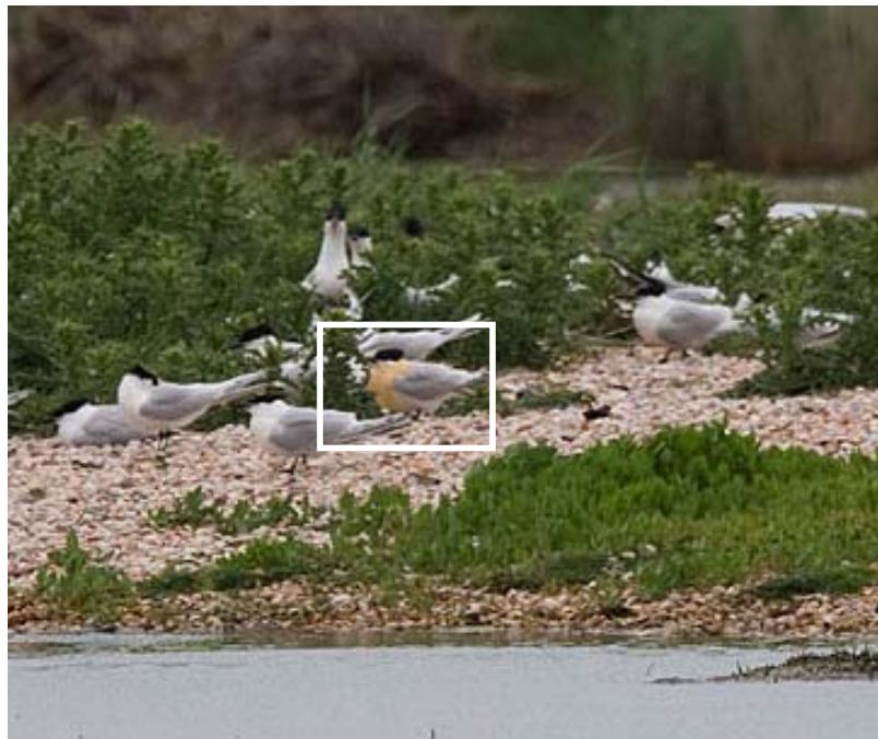
Figuur 4. Grote Stern 1-049 gezien van 24-05-2009 tot 27-25-2009 in de Petten (Texel). Sandwich Tern 1-049 seen from 24-05-2009 until 27-25-2009 in de Petten (Texel).