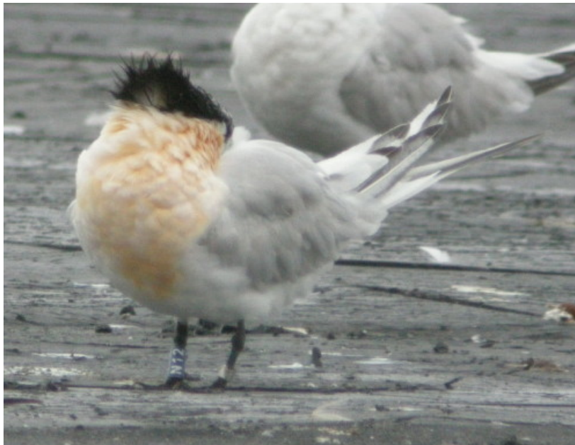
Figuur 6 Grote Stern N12 op 30-07-2010 in Musselburgh, Schotland Sandwich Tern N12 on 30-07-2010 in Musselburgh, Scotland.