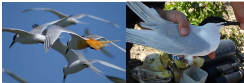
Figuur 1. Gekleurde Grote Stern op de Scheelhoek in het Haringvliet met radiozender op de rug (links), aluminium ring om linkerpoot en kleurring om de rechter poot (rechts). Sandwich Tern radio-tagged and colour-dyed (left), and ringed and colour-ringed (right), in the Scheelhoek colony in the Haringvliet (R.C. Fijn).

In de broedseizoenen van 2009 en 2010 zijn in de kolonie op de Scheelhoek in het Haringvliet in totaal 30 Grote Sterns gevangen en voorzien van een plastic kleurring (in 2009 een ongecodeerde gele kleurring, in 2010 een INTERREX lichtblauwe kleurring met 1 witte letter en twee cijfers), een 'gecodeerde' radiozender (1 gram, Firma Microtes) en een kleurmerk op het verenkleed (figuur 1). Met behulp van de radiozenders was het mogelijk om gezenderde sterns met een speciale ontvanger op te sporen vanaf de kust of vanuit een vliegtuig. Met behulp van deze radiozenders kon het gebiedsgebruik van de sterns in de Voordelta in kaart worden gebracht om daarmee vragen te beantwoorden over waar sterns foerageren in het gebied en hoe intensief de zandplaten gebruikt worden om te rusten. De gezenderde vogels werden gekleurd met picrinezuur (geel) of zilvernitraat (zwart/bruin). Dit zijn kleurstoffen die zich binden aan eiwitten en zodoende het gehele seizoen blijven zitten en tot in het najaar aanwezig zijn. Bij de lichaamsrui in augustus verdwijnen de gekleurde veren. Door combinaties van kleurmerken op kop, vleugels en staart waren de vogels individueel herkenbaar.