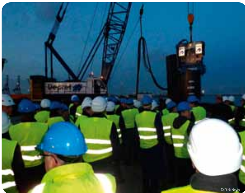
In november geeft Vlaams Minister van Mobiliteit en Openbare Werken Hilde Crevits (CD&V) het startsein voor grootschalige werken aan de CHZ-Oostkaai in Zeebrugge.

In november geeft Vlaams minister van Mobiliteit en Openbare Werken Hilde Crevits (CD&V) het startsein voor grootschalige werken aan de CHZ-Oostkaai in de haven van Zeebrugge. De containerkade zal worden uitgebaggerd tot een diepte van 16 meter waardoor de nieuwste generatie grote containerschepen – die binnen enkele jaren in de vaart komen – probleemloos de haven zullen kunnen aandoen.