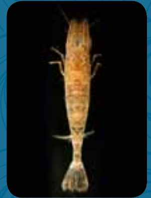
De levende garnalen worden tijdens een laatste sleep gevangen, korte tijd voor het vaartuig aanmeert.

Previs, het zelfstandig orgaan binnen het Zeevissersfonds dat zich bezig houdt met de veiligheid op Belgische vissersvaartuigen, introduceert in maart samen met de Rederscentrale het Man Overboord systeem (MOB). Dat bestaat uit een zender die elk bemanningslid steeds bij zich moet dragen. Als iemand overboord gaat, wordt het signaal opgevangen door een ontvanger in de stuurhut en indien nodig door zoekende helikopters. Het initiatief wordt gefinancierd met provinciale, Vlaamse en Europese middelen.