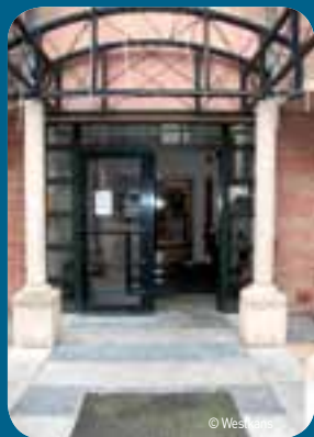
Uit een onderzoek van Westkans blijkt dat slechts 8,6 procent van de restaurants en cafés aan de kust voldoende toegankelijk zijn.