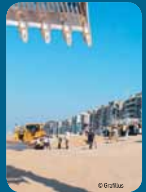
Op ongeveer één derde van de kustlijn zijn ingrepen nodig.