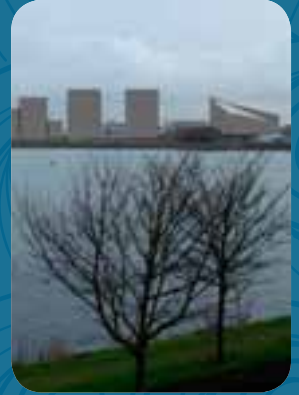
De Bestendige Deputatie beslist dat er een ruimere windstudie moet komen voor het geplande bouwproject aan de Spuikom te Oostende.

Watersportverenigingen hadden begin dit jaar bij de Raad van State de schorsing van een eerder goedgekeurd RUP bekomen wegens gebrek aan een windstudie. Die studie komt er dan toch en daaruit blijkt dat de invloed van de hoogbouw op de wind, beperkt zou blijven. De watersportverenigingen hebben hun twijfels bij de bevindingen in het rapport en vechten opnieuw het RUP aan bij de Raad van State. De Bestendige Deputatie van West-Vlaanderen beslist dat er een nieuwe en ruimere windstudie moet komen.