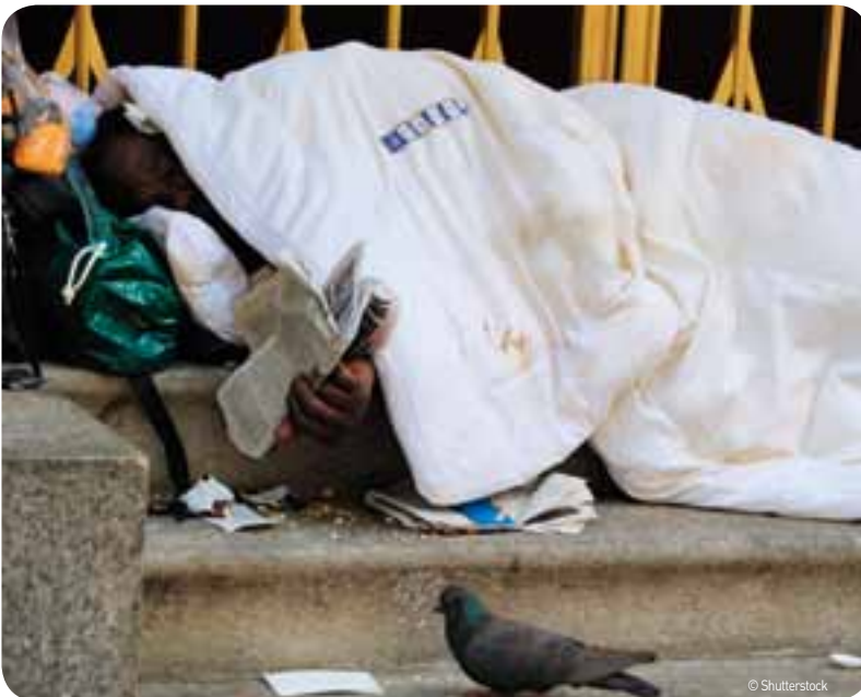
Naast de repressieve aanpak dringt zich een humanitaire aanpak op.

Naast de repressieve aanpak dringt zich een humanitaire aanpak op. Transitillegalen beseffen dat het 'Westen' niet het paradijs is en dat ze bovendien niet welkom zijn. Ze verdwijnen wel uit het straatbeeld, maar niet uit de kustregio. Ze verbergen zich overdag in kraakpanden en leegstaande gebouwen, en komen nooit meer in groepen op straat, want zo maken ze minder kans om opgepakt te worden. Het voorbije jaar stelt het Centrum Algemeen Welzijnswerk en Jeugdzorg Middenkust (CAW) vast dat het bieden van voedsel, medische verzorging en informatie het vertrouwen niet alleen vergroot, maar dat ook meerder illegalen bereid zijn om zich op vrijwillige basis te laten repatriëren naar het land van herkomst.