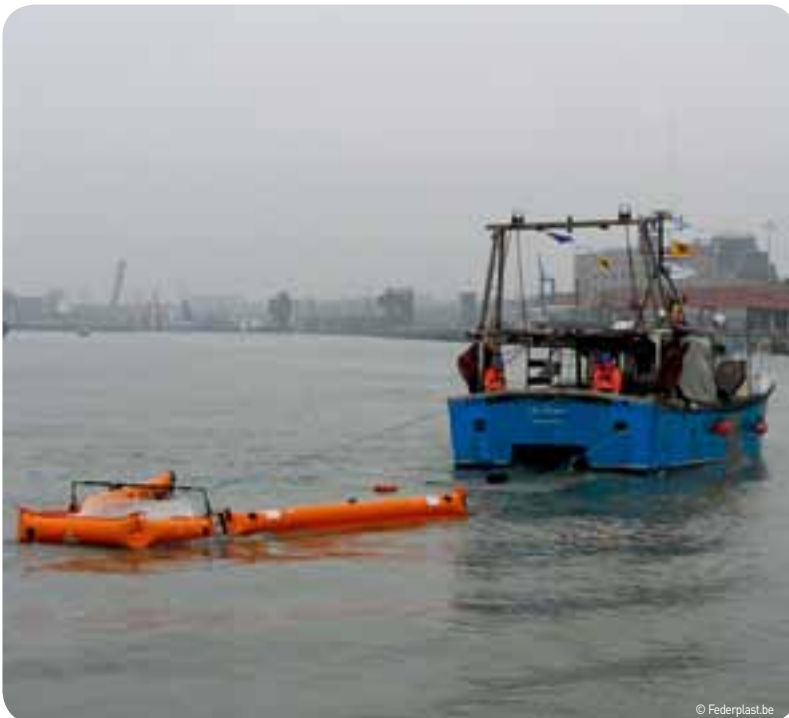
Met een speciale installatie aan boord van de vissersschepen kunnen voortaan alle soorten drijvend afval ingezameld worden.