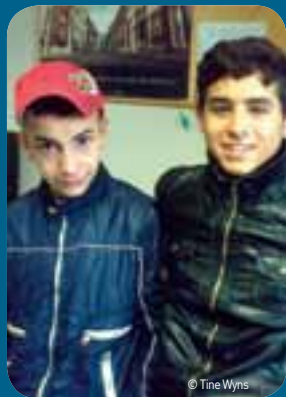
Aan de Belgische kust vertoeven volgens ruwe schatting een 600 tot 800-tal illegalen.