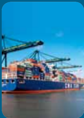
De haven van Zeebrugge noteert in 2011 zijn op één na beste jaar.