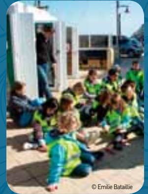
Aan de tentoonstelling strandafval worden workshops gekoppeld.

'Het multifunctioneel strandcentrum te Westende-Bad sluit aan bij de zeedijk en betekent een aanzienlijke kwaliteitsverbetering.'