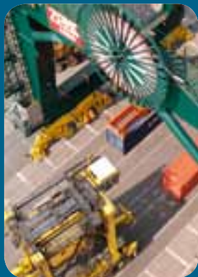
De containerkade zal worden uitgebaggerd tot een diepte van 16 meter waardoor de nieuwste generatie grote containerschepen de Zeebrugse haven kunnen aandoen.