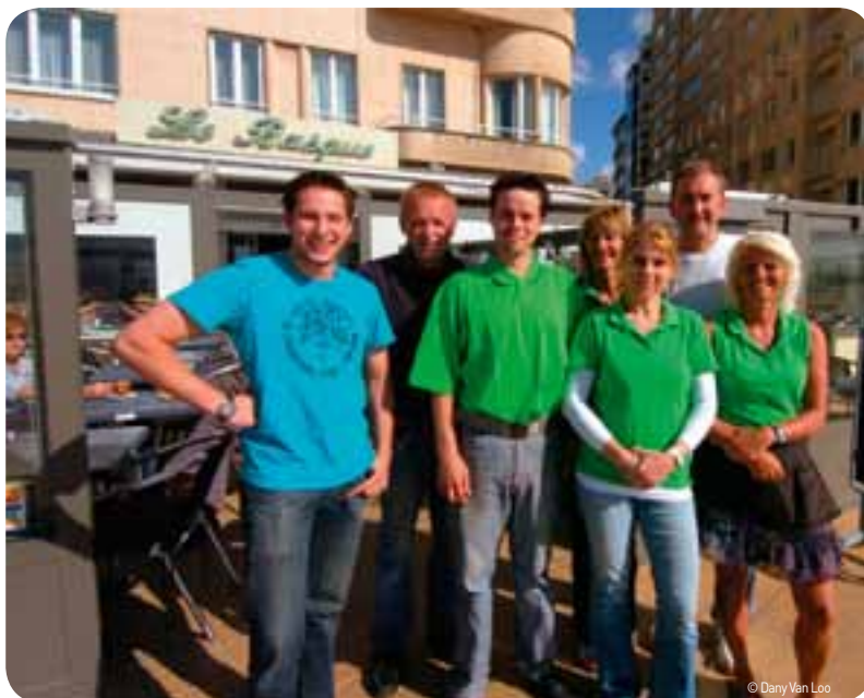
Het nijpend personeelstekort is een probleem voor de horeca.

De horeca aan zee heeft het niet gemakkelijk. Het aantal faillissementen in de toeristische sector aan de kust stijgt met bijna de helft in vergelijking met vorige jaren. Ook het nijpend personeelstekort blijft er voor problemen zorgen. VDAB Oostende zet zijn horecaopleidingen extra in de kijker en werkt die zoveel mogelijk op maat van de sector uit.