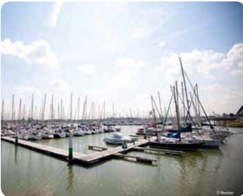
De uitbreiding van de Nieuwpoortse jachthaven omvat 600 extra ligplaatsen, gekoppeld aan andere activiteiten.