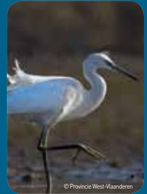
Streefdoel is opnieuw zoals in de jaren 1980 vele vogels aan te trekken, zoals deze kleine zilverreiger.