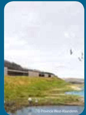
Het kijkcentrum is in de dijk ingewerkt en biedt panoramisch zicht op de Zwinvlakte.