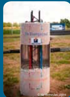
Met de eerste energiepaal wordt een belangrijke stap gezet in de verdere uitbouw van het wetenschapspark Greenbridge in Oostende.

Begin juli wordt de eerste energiepaal in de grond geboord in aanwezigheid van de rector van de Universiteit Gent Paul Van Cauwenberge, senator en minister van Staat Johan Vande Lanotte, West-Vlaams gedeputeerde Marleen Titeca-Decraene en uittredend afgevaardigd bestuurder van Greenbridge Greet Van Eetvelde. Hiermee wordt een belangrijke stap gezet in de noodzakelijke verdere uitbouw van het wetenschapspark Greenbridge op het bedrijventerrein Plassendale in Oostende. Er komt een nieuwe vleugel met kantoren en de realisatie van de Energy Box, een demonstratiefaciliteit voor nieuwe energietechnologieën zoals onder meer een zonnekoepel en zonnepanelen in de vorm van dakpannen. Het nieuwe complex zal rusten op 98 palen, waarvan 40 energiepalen van 15 meter waarbij in het beton technologie wordt aangebracht om energie uit de grond te halen. De buizen in de stalen constructie laten toe dat de aardwarmte gerecupereerd en omgezet wordt in energie. Ook grote spelers geloven in de toekomst en de mogelijkheden van Greenbridge. Daikin, Renson en Siemens tekenen een verregaande samenwerkingsovereenkomst met het wetenschapspark.