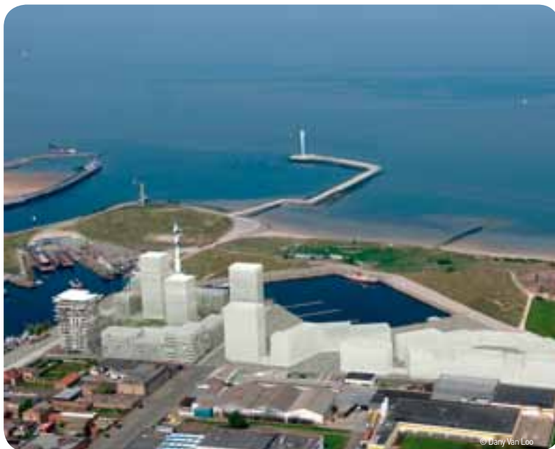
In mei worden de plannen voorgesteld van een groots bouwproject op de Oostendse oosteroever.

Oostende krijgt er een nieuwe skyline bij. In mei worden de plannen voorgesteld van een groots bouwproject dat over een periode van vijftien jaar de Oosteroever rond het Vuurtorendok en de H. Baelskaai een nieuw aanzicht moet geven. Er komen 1.200 appartementen op een oppervlakte van 12 hectare. Het grootste ontwikkelingsproject aan de kust in jaren roept heel wat vragen op bij de daar gevestigde maritieme bedrijven, die zich in hun voortbestaan bedreigd voelen. Dat blijkt op een door UNIZO en het Economisch Huis ingerichte infovergadering in november. Ook de gevolgen voor de mobiliteit in de regio blijken een belangrijk punt te zijn.