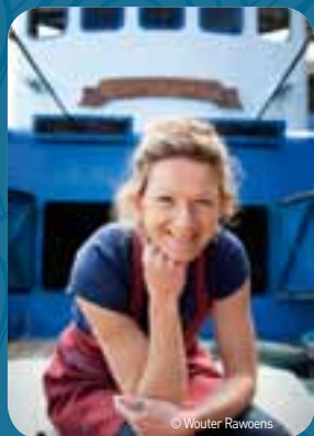
Met 'Vissersvrouwen' plaatst de provincie de vrouw achter de visser in de schijnwerper.