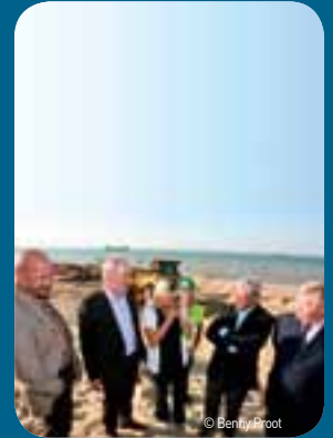
Minister Crevits geeft in oktober in Koksijde het officiële startsein voor de uitvoering van het Geïntegreerd Kustveiligheidsplan.

In 2011 is al heel wat geïnvesteerd in werken die dringend nodig zijn zoals het Openbare Werken Plan in Oostende. Het groeistrand werd met zand hervoed en de werken voor de heraanleg van het Zeeheldenplein zijn van start gegaan. Dat plein wordt verbreed en krijgt een golfdempende uitbouw. De beschermingswerken door de verbreding van de stranden in Koksijde en De Panne werden gerealiseerd. De verbreding van het strand in De Haan (Wenduine) en het hervoeden van de stranden in Duinbergen en Koksijde zijn opgestart. Opvallend is dat er in Bredene geen maatregelen nodig zijn. Daar zullen de hoge duinen voor voldoende bescherming tegen de 1.000-jarige storm zorgen.