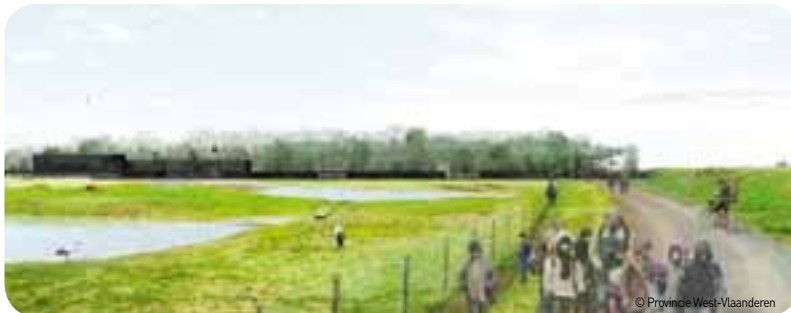
In februari wordt het winnende wedstrijdontwerp voor het nieuwe eigentijdse 'Natuureducatief Ecotoeristische Zwin', het Zwin Natuurcentrum voorgesteld.

Het gekozen ontwerp vormt de basis voor verdere besprekingen. In 2012 wordt het voorontwerp opgemaakt en goedgekeurd, op basis waarvan de uitvoering zal plaatsvinden tijdens de daaropvolgende jaren.