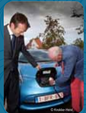
Knokke-Heist wil elektrische voertuigen in de badstad promoten en sluit een overeenkomst voor de aanleg van oplaadpunten in de stad.