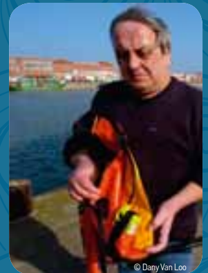
Previs introduceert samen met de Rederscentrale het Man Overboord systeem (MOB).