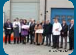
In aanwezigheid van Maria Damanaki, de Europese Commissaris voor Maritieme Zaken & Visserij, toont de kunststofindustrie haar wil om te werken aan oplossingen voor het voorkomen en verwijderen van zwerfvuil in zee.

Federplast.be, de Belgische vereniging van producenten van kunststof- en rubberartikelen, kondigt op deze dag de lancering aan van een Belgisch pilootproject voor het opvissen van drijvend afval voor de Belgische kust. Met een speciale installatie aan boord van de vissersschepen, kunnen voortaan alle soorten afval ingezameld worden. Het project werd opgezet in samenwerking met SDVO, de Vlaamse Stichting voor Duurzame Visserijontwikkeling, de Europese Waste Free Oceans Foundation en met de financiële steun van Essenscia, de Belgische Federatie van de Chemische Industrie en Life Sciences.