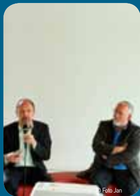
Een boodschap van Johan Vande Lanotte voor het Coördinatiepunt Duurzaam Kustbeheer: 'Het Coördinatiepunt moet haar grenzen verleggen door samenwerking met buurlanden uit te bouwen.'

'Een BAK, Bestuursakkoord Kust, zou ons een heel stuk verder brengen.'