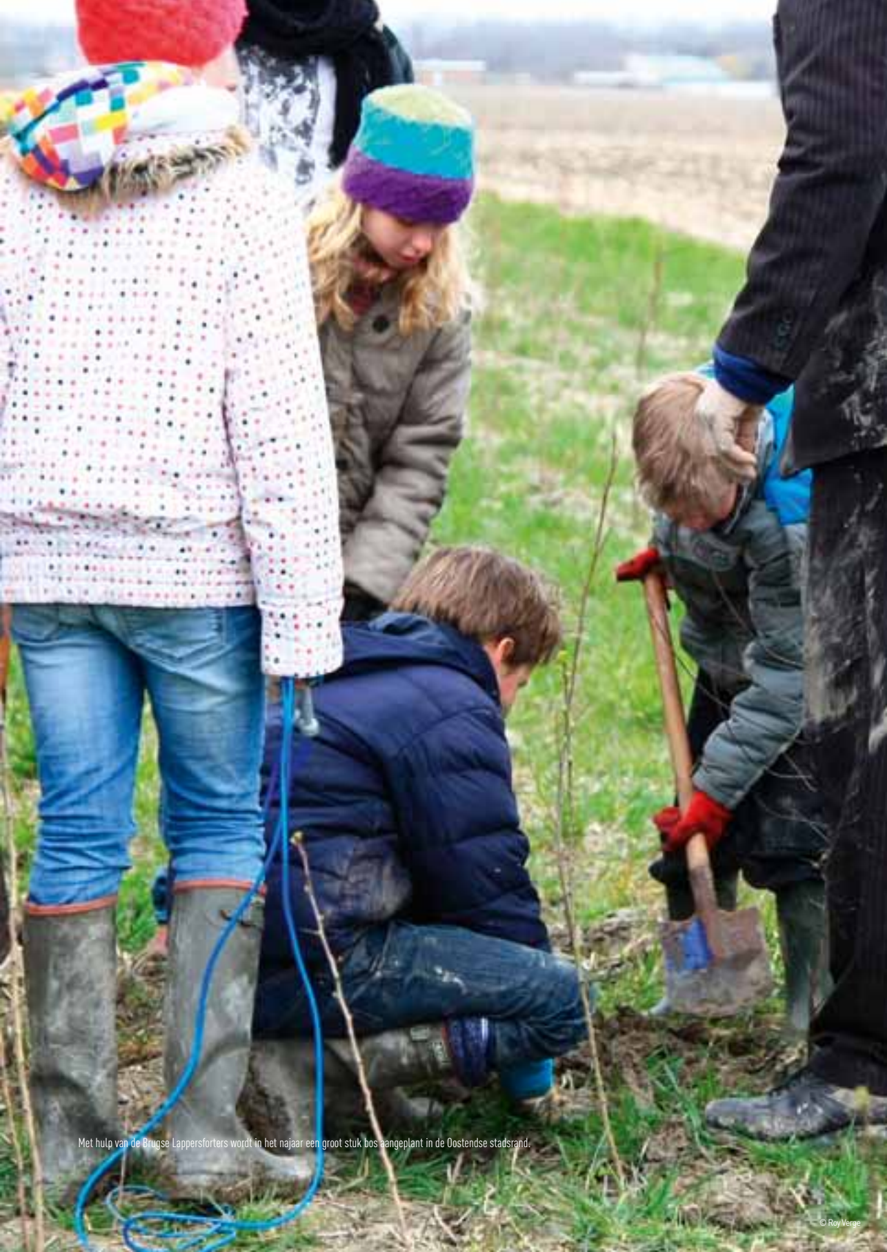
Met hulp van de Brugse Lappersforters wordt in het najaar een groot stuk bos aangeplant in de Oostense stadsrand.