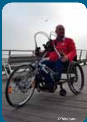
De website www.iedereenfietst.be brengt toegankelijkheid van 360 km fietsnetwerk in kaart, vertrekkend in 10 kustgemeenten.