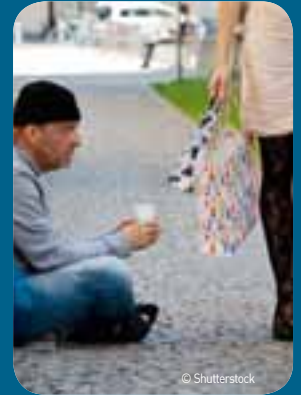
25 procent van alle inwoners van een (West-Vlaamse) kansarme buurt woont in Oostende.

'De kansarmoedeatlas kan een handig instrument voor de beleidsvoering zijn.'