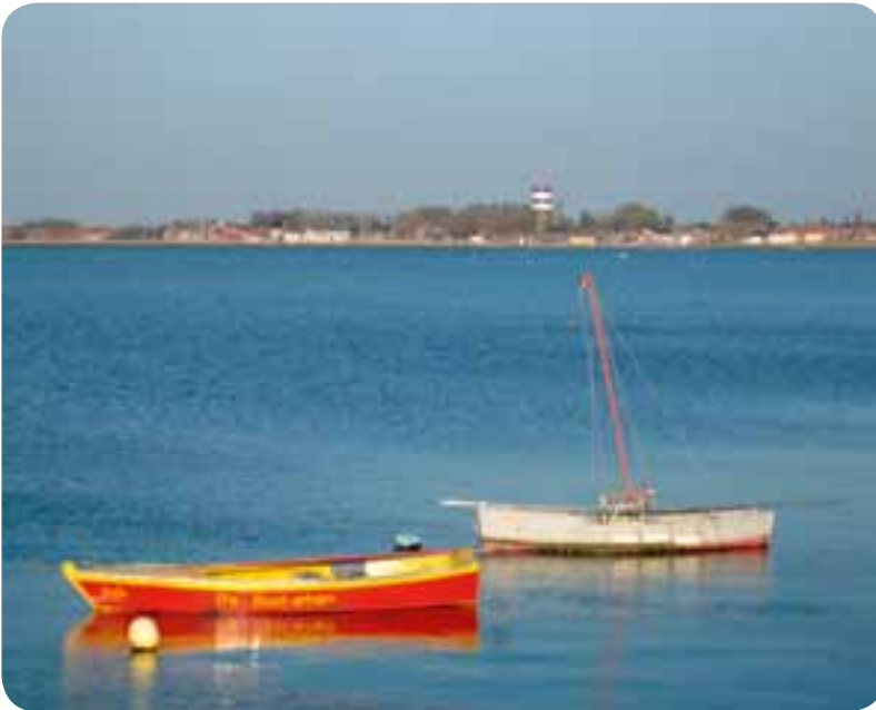
Het RUP Kop van 't Sas maakt de realisatie van een groot bouwproject met 600 woongelegenheden en torens tot 40 meter hoog mogelijk.