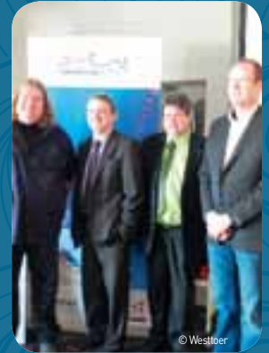
Westtoer lanceert het concept 'Belgian Coast Greeters', vrijwilligers die hun eigen badplaats promoten bij toeristen.