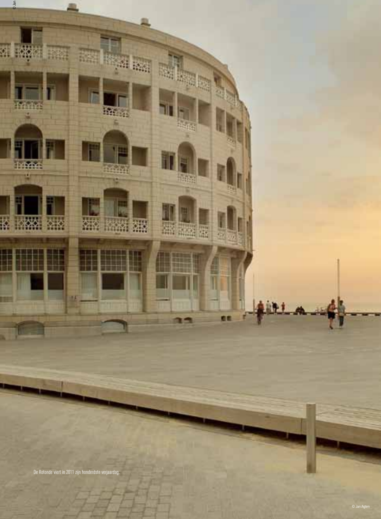
De Rotonde viert in 2011 zijn honderdste verjaardag.