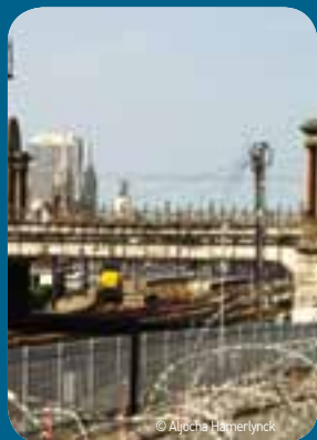
Illegale vluchtelingen die de treinsporen proberen over te steken leggen in januari en februari regelmatig het treinverkeer stil.