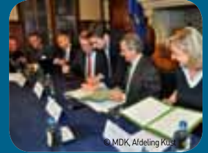
Een samenwerkingsovereenkomst wordt ondertekend voor de uitbreiding van de Nieuwpoortse jachthaven.

Het Agentschap voor Maritieme Dienstverlening en Kust (MDK) van de Vlaamse overheid, de Provincie West-Vlaanderen en het stadsbestuur van Nieuwpoort ondertekenen in oktober een samenwerkingsovereenkomst om binnen afzienbare tijd de grote uitbreiding van de Nieuwpoortse jachthaven te realiseren. Die uitbreiding omvat 600 nieuwe ligplaatsen, gekoppeld aan woonprojecten, jachthavengebonden activiteiten en bedrijven, diverse horecagelegenheden en een botenparking.