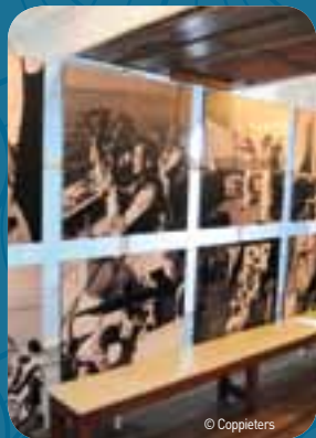
De Mercator kreeg een totaal nieuwe museale invulling.