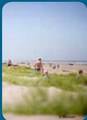
Het warme voorjaar en de mooie najaarsdagen zorgen voor enkele topweekends.

‘Twee derden van de omzet voor toerisme wordt buiten het hoogseizoen gedraaid.’