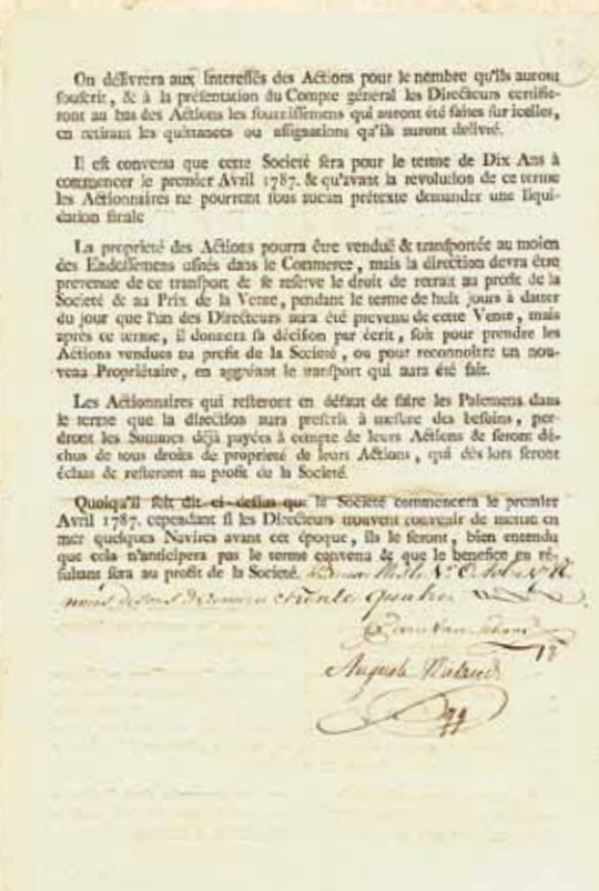
Fig. 2 Keerzijde (verso) van het aandeel, dat op 1 oktober 1786 werd ondertekend door Pierre Van Schoor en Auguste Wieland, de directeurs van de onderneming.