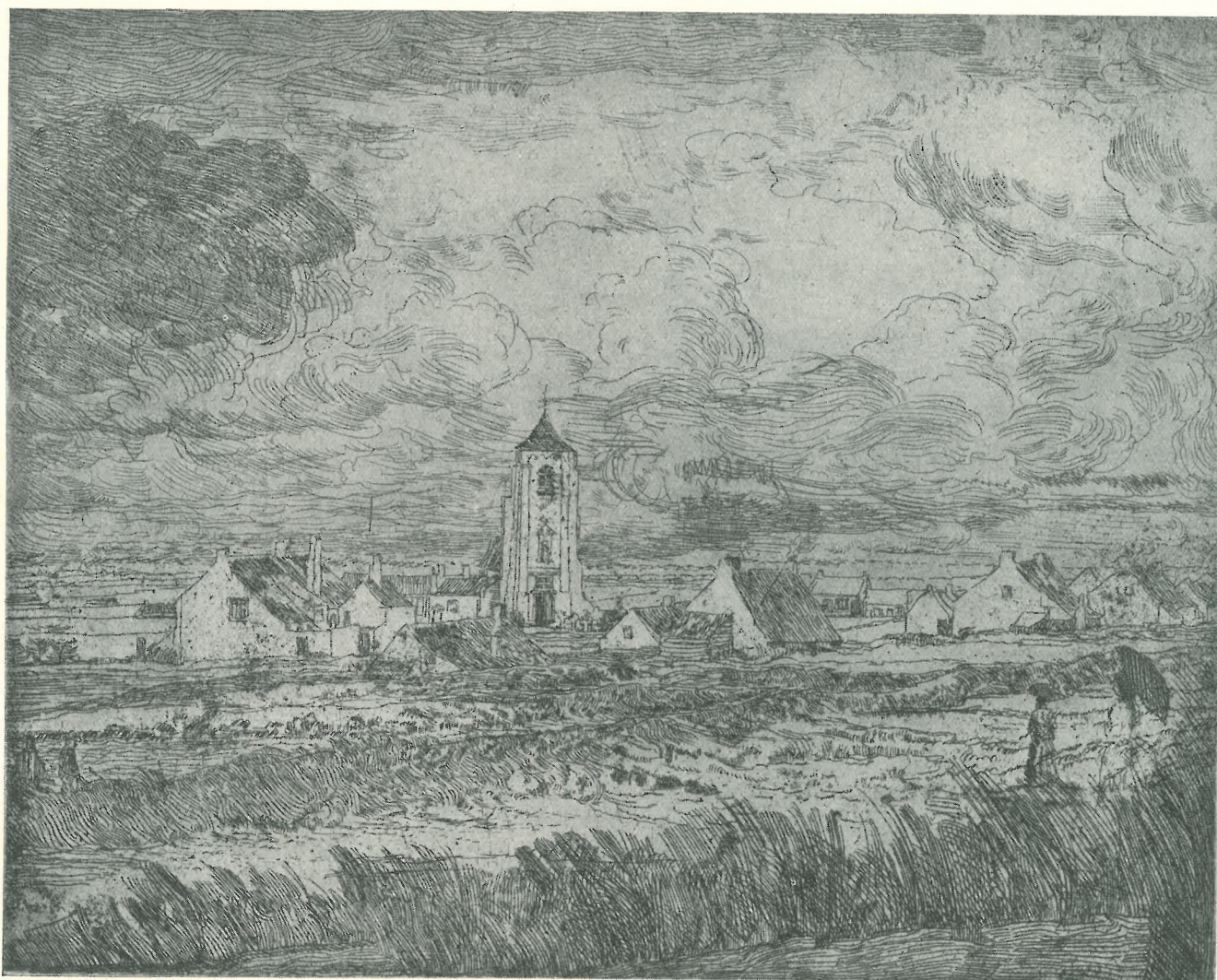
Mariakerke en 1887 d'après une eau-forte du baron James Ensor.

On devait l'aimer, ce sanctuaire, car, dans toute la Flandre, il n'y en avait pas de plus poétiquement humble et de plus sincèrement chrétien. On y respirait un troublant parfum de christianisme primitif et de douce mysticité, on y vivait