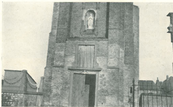
Onze Lieve Vrouw ter Streep en 1929.

Lorsqu'une compétence autorisée aura parfait cette restauration, quand un maître habile aura rafraîchi les