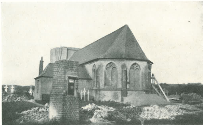
L'église en 1929.

à sa muraille où le Christ étend ses bras émaciés au-dessus des tombes de tant de générations de pauvres gens qui y dorment leur dernier sommeil; et on priait, dans ce site