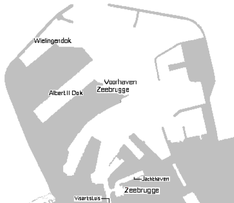
Kaart : Voorhaven Zeebrugge

aanduiding van resp. Tijdok en Prins Albert dok gebruikt) (Bilé & Trips 1970). Deze dokken zijn een oostelijke aftakking, zo'n tweehonderdvijftig meter noordwaarts van de Visartsluis, van de oude vaargeul en dus ook onderhevig aan de getijden (zie kaartje).