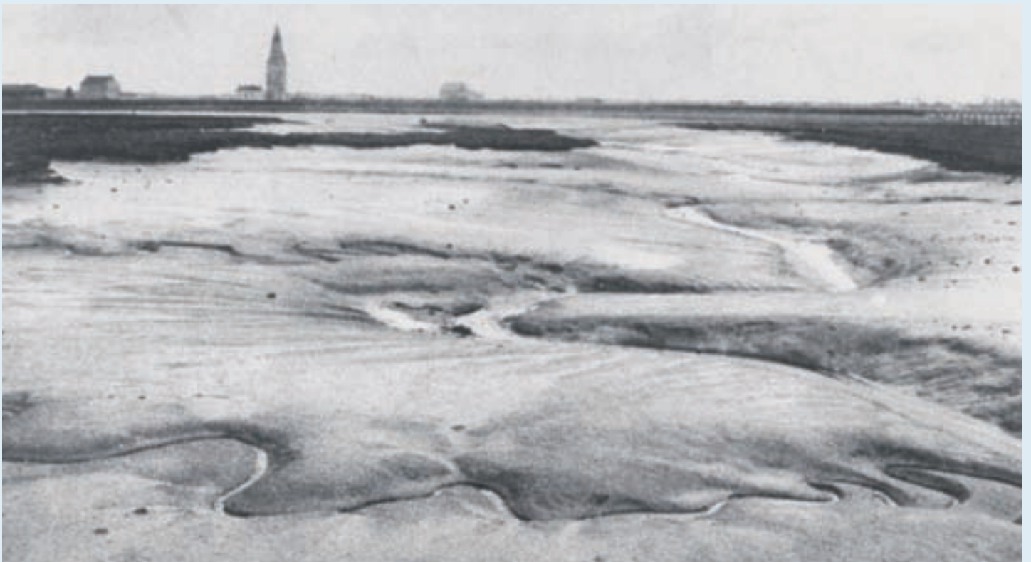
Deze foto toont de kreek van Lombardsijde met in de verte de vierboete (oude vuurtoren) van Nieuwpoort. Dit plaatje van rond het begin van de 20 ste eeuw geeft vermoedelijk een goed beeld van hoe de vroegste ides er moeten hebben uitgezien (collectie Nationaal Visserijmuseum van Oostduinkerke)

( Koxide , Koxhide , Coxhiide , Cocxide ) verwijst de naam naar een 'ide' of aanlegplaats, en staat ze in verband met een zekere Cok . Volgens E. Vlietinck, die zich reeds in 1936 over deze materie boog, kan deze Cok de eerste hier actieve reder of de voornaamste inwoner zijn geweest van het gehucht dat zich rond de aanlegplaats vormde. Ter ondersteuning verwijst hij naar diverse andere toponiemen zoals Coxland (bij Westkerke), Coxmoere (landerij bij Varsenare), de Coxweg (St-Kruis, Zeeland). Een andere mogelijke verklaring verwijst naar het woord kok , als ronde hoogte of duin. De alternatie-