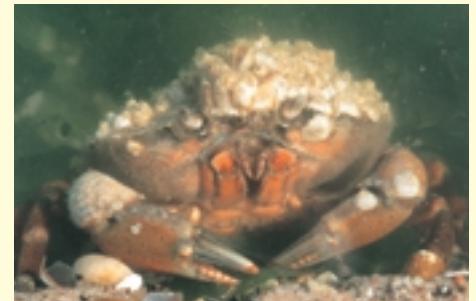
Krab begroeid met zeepokken

zandbanken aanwezig. Ze vormen vaak ware onderwatermu- ren, die – op één uitzondering na, de Broersbank t.h.v. Koksijde – net niet droog komen te liggen bij extreem laagtij. De grote hoeveelheid bodemorganismen die op deze zandbanken leven vormen een belangrijke voedselbron voor zee-eenden en voor vele vissoorten . Deze laatste zijn op hun beurt van groot belang als voedsel voor weer andere zeevogels . Daarnaast fungeren de zandbanken uitstekend als kraamkamer voor vele vissoorten en ongewervelden.