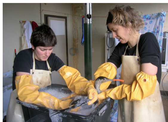
■ Het wassen van een olieslachtoffer, hier een Roodkeelduiker, moet snel en nauwkeurig gebeuren (CV)