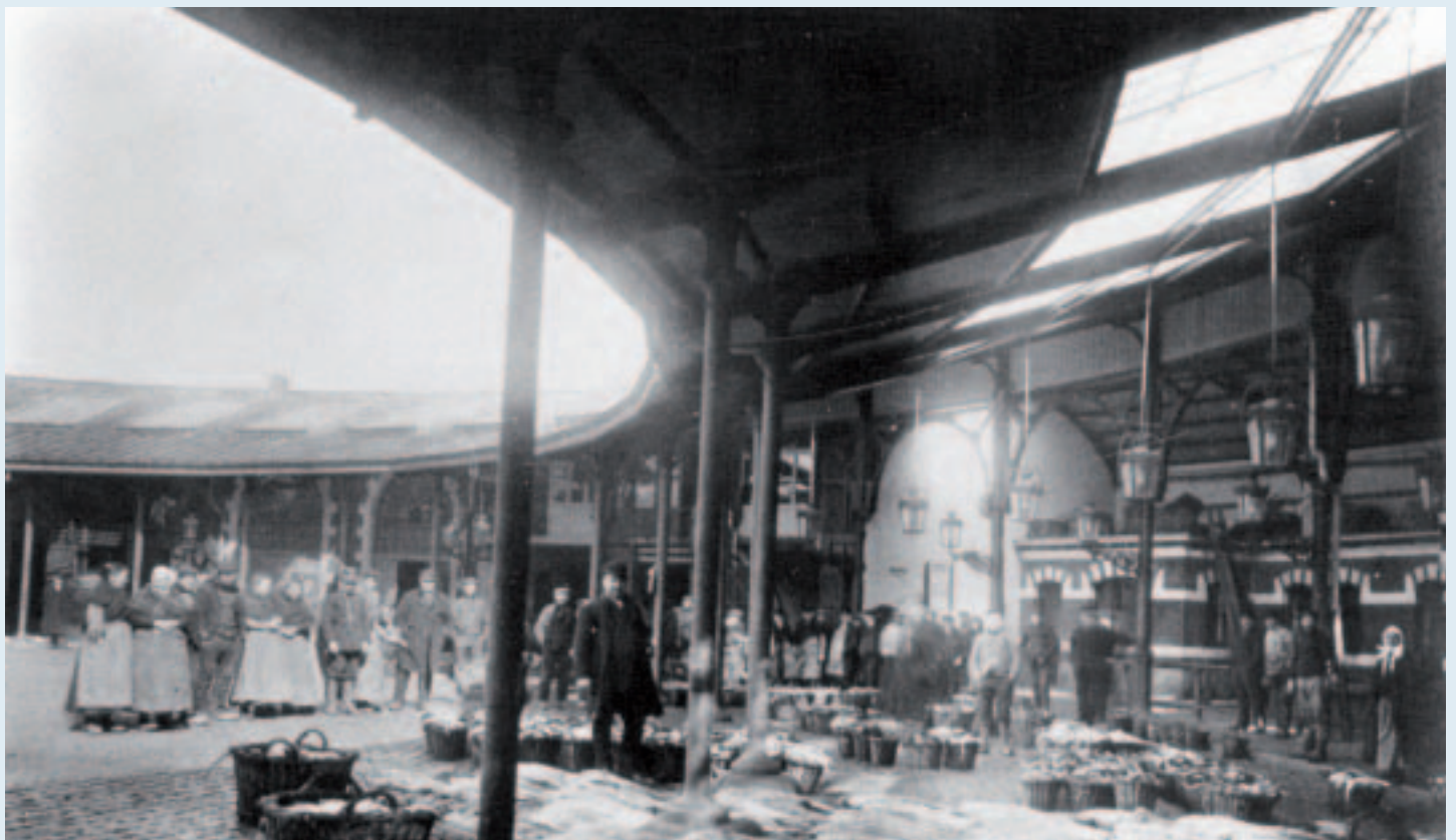
■ In 1877 werd in Oostende een circelvormige vismijn, de "Cirk" gebouwd, die in 1878 in gebruik werd genomen (foto eind 19de eeuw, collectie Nationaal Visserijmuseum; bron: Vlaamse visserij en vissersvaartuigen, deel I - de havens, Gaston en Roland Desnerck, 1974)

Het Nederlandse woord ( vis )afslag is afgeleid van het werkwoord afslaan , dat we nog kennen in de betekenis 'in prijs verminderen', d.i. het tegenovergestelde van opslaan , 'in prijs vermeerderen, duurder worden'. Afslaan en opslaan vinden hun oorsprong in het veilingbedrijf. Afslaan is wat de veilingmeester doet als een te verkopen goed is ingezet op een (soms onrealistisch) hoog bedrag, dat niemand wil betalen. Hij vermindert dat bedrag tot zich een geïnteresseerde koper aanmeldt. Vroeger ging de afroeping van een lagere prijs telkens gepaard met een slag van de hamer door de veilingmeester. De som werd dus letterlijk "afgeslagen". En vandaar de uitdrukking: verkoop bij afslag . Bij een verkoop per opbod werd op dezelfde wijze de prijs "opgeslagen": elk hoger bod werd door de verkoper herhaald en bevestigd met een tik van de hamer op de tafel. In het oudere Nederlands werd een verkoop bij opbod dan ook verkoop bij opslag genoemd. Vis wordt echter van oudsher "bij afslag" geveild, althans in de Nederlanden zijn er geen bewijzen dat dit ooit per opbod gebeurde. Van de veilingpraktijk ging de benaming afslag over op de plaats waar op die manier vis openbaar verkocht wordt.