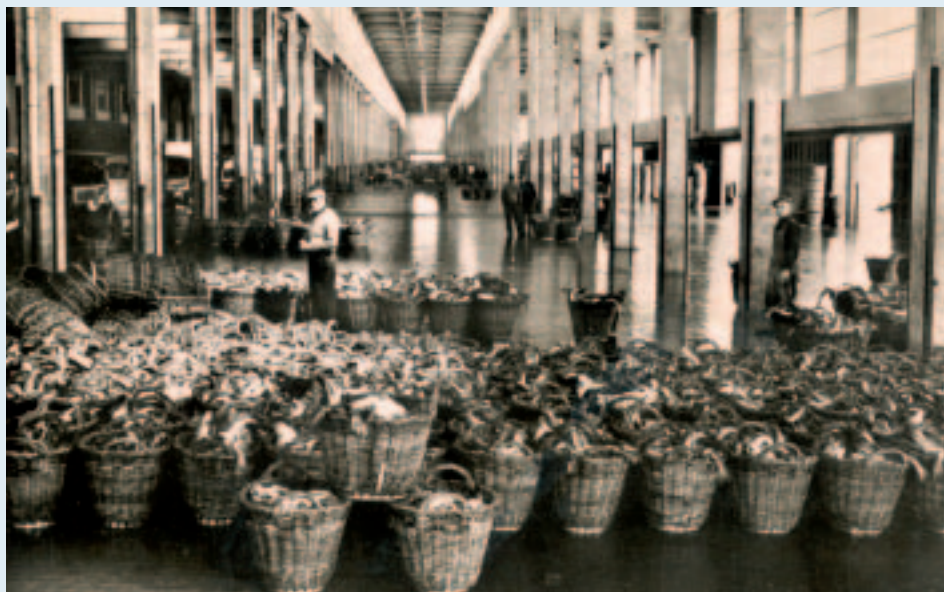
■ De overdekte hal bij een vissershaven waar vers gevangen vis van de boten wordt aangevoerd en geveild heet 'vismijn' in België en 'visafslag' in Nederland. Deze foto werd genomen in de Oostendse vismijn eind de jaren '1950, begin de jaren '1960

Die gelijkenis is evenwel misleidend, want het grondwoord in vismijn heeft een totaal andere oorsprong dan dat in kolenmijn e.d.. Het gaat terug op het werkwoord mijnen , dat al in het Middelnederlands voorkwam en afgeleid is van het persoonlijke of bezittelijke voornaamwoord mijn (van de eerste persoon enkelvoud). Tijdens openbare