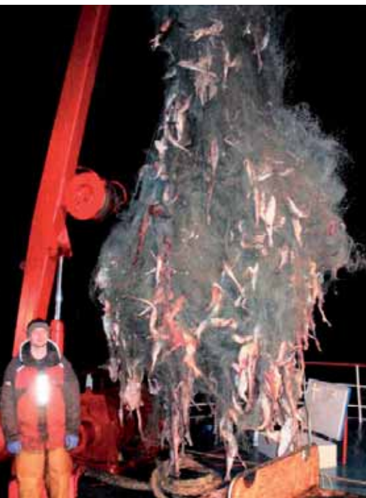
■ Een verloren kieuwnet opgevist door een Schotse trawler ten westen van de Hebriden op 600m diepte (Hareide et al., 2005)

worden door de visser (omdat ze bv. op drift zijn geraakt na een storm) dan kunnen ze blijven vissen zonder dat de vis geoogst wordt. Dit veroorzaakt onnodige en nutteloze sterfte onder de visbestanden. Maar ook hier is enige nuancering op zijn plaats. Wetenschappers hebben namelijk aangetoond dat in rustige wateren deze netten inderdaad lang (tot enkele jaren) hun vissend vermogen kunnen behouden. Maar in hoogdynamische milieus met sterke stromingen, zoals de Zuidelijke Noordzee, gaan de netten al snel hun eigenschappen om te vissen verliezen waardoor het spookvissen stopt (zeker voor vis, in mindere mate voor kreeftachtigen zoals noordzeekrab). Dit betekent niet dat het net niet in het milieu achterblijft als afval.