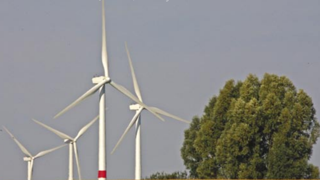
Windmolens in Waals-Brabant

Administratie voor Energie van het Waalse Gewest: energie.wallonie.be