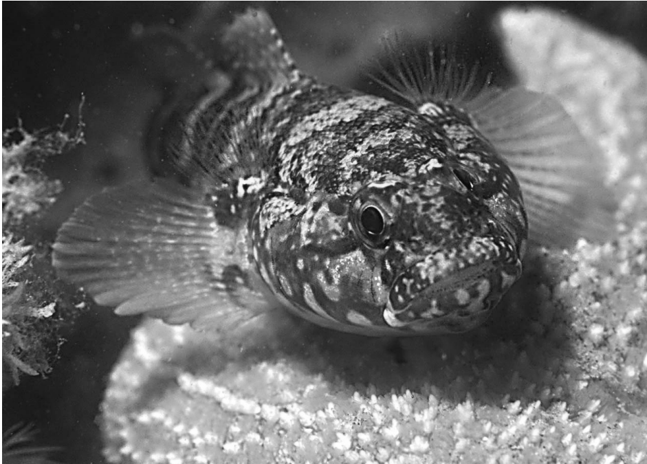
Figuur 1. Paganelgrondel ( Gobius paganellus). Anna-Frisopolder, 18-6-2005

de randvoorwaarden voor een goede bestandsopname, werden de vondsten niet geregistreerd dan wel geconserveerd. Helaas is daarmee ook de vindplaats niet goed te achterhalen. De ene locatie lag tussen de Westhinder en Oosthinder, de andere ten noordwesten van de Noordhinder. Het gaat in elk geval om een vangst op minimaal 35 km uit de kust.