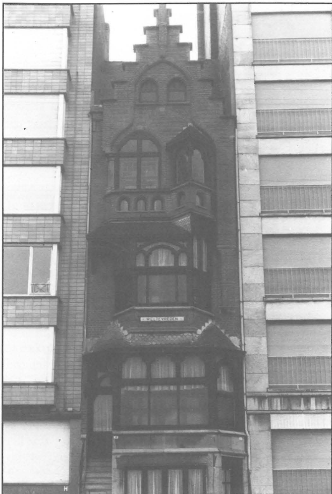
Duinbergen, Villa Weltevreden, Zeedijk 318. Een beklemmend gezicht !.