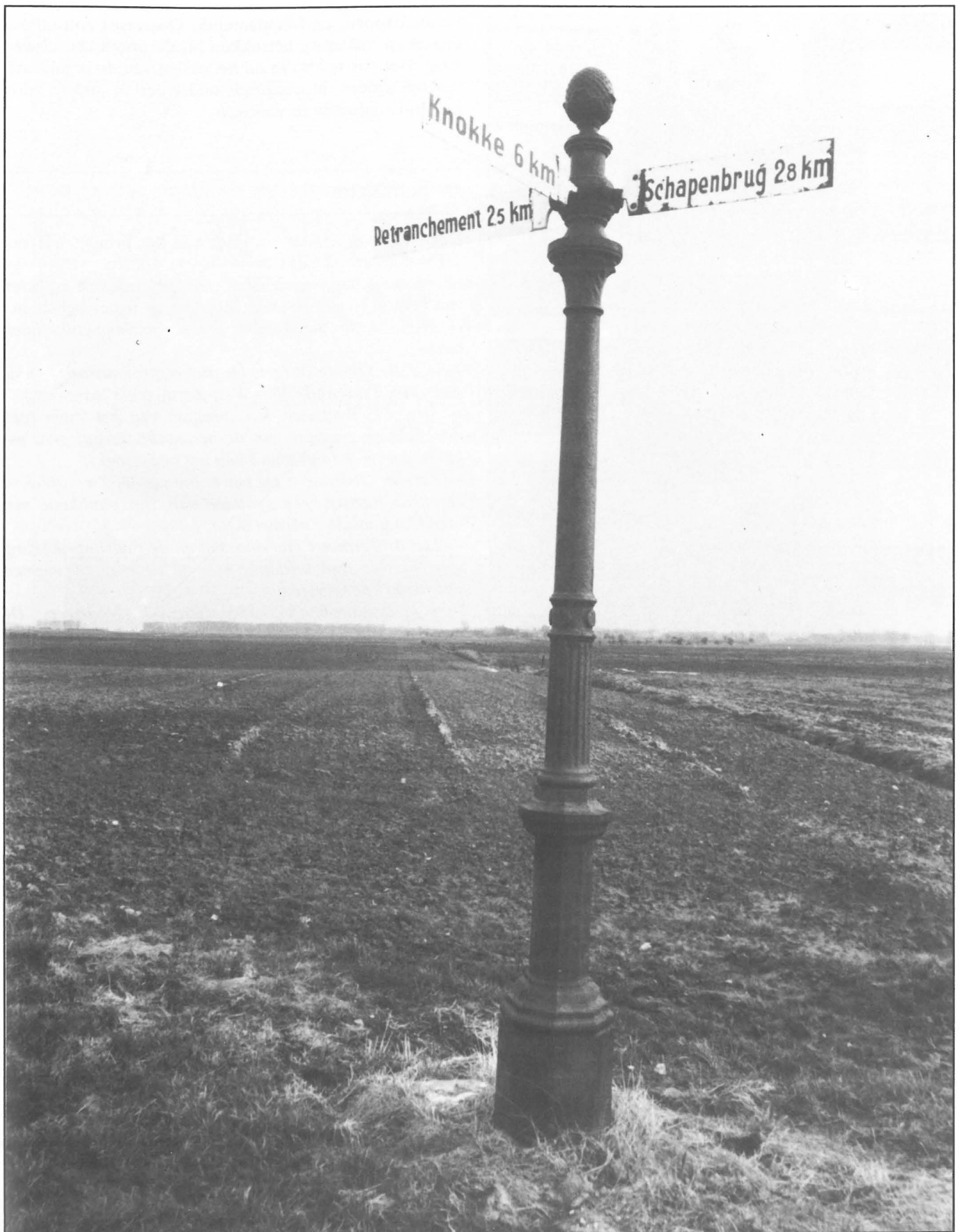
Oude richtingaanwijzer in de 'Vrede', op het kruispunt van de Hazegrasstraat en Graaf Jansdijk.