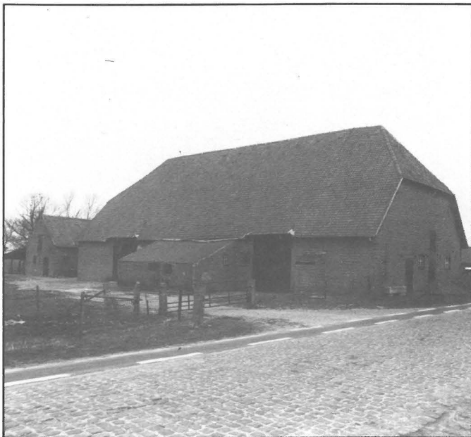
Knokke-Heist, schuur van de Grote Stelle-hoeve, Hazegrasstraat 120.

Landschappen, en Mappamundi. Daarnaast zijn tal van musea en instanties betrokken bij de praktische uitwerking. Het ligt tevens in de bedoeling van de organisatoren om tijdens de weekends onder één of andere vorm passende animatie te voorzien.