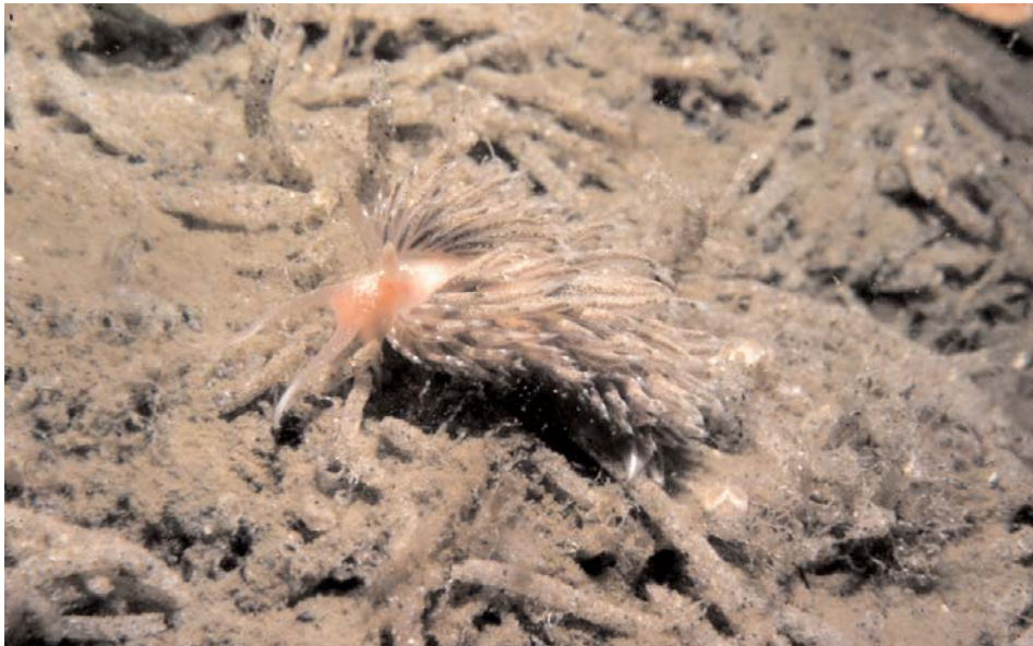
foto 4. Facelina bostoniensis , Marsdiep Texel 4 juli 1978 (foto: Godfried van Moorsel, ecosub).