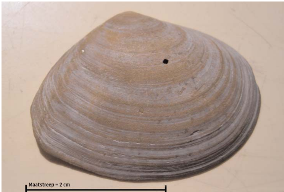
Foto 1. Ovaal nonnetje ( Macoma calcarea ) van Ameland.