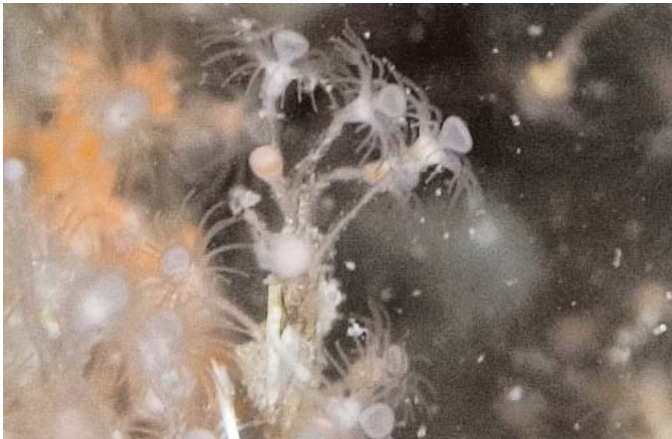
Foto 2 (zie pag. 61). Eudendrium arbuscula.