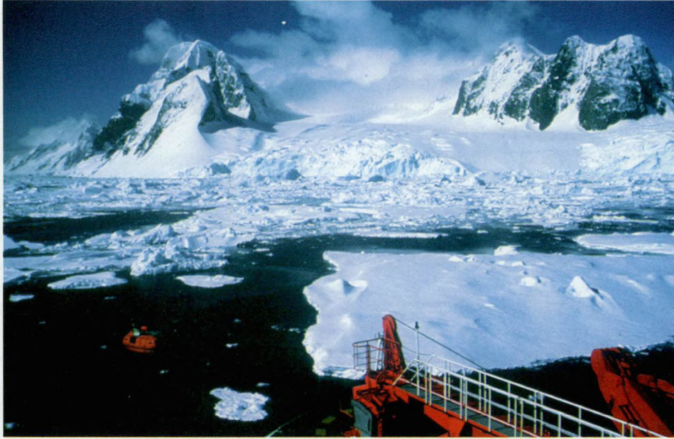
Oceanografisch onderzoek in Antarctica.