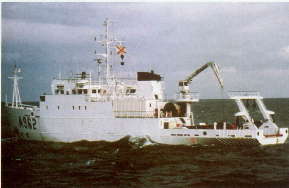
Het oceanografisch onderzoeksschip R.V. Belgica.