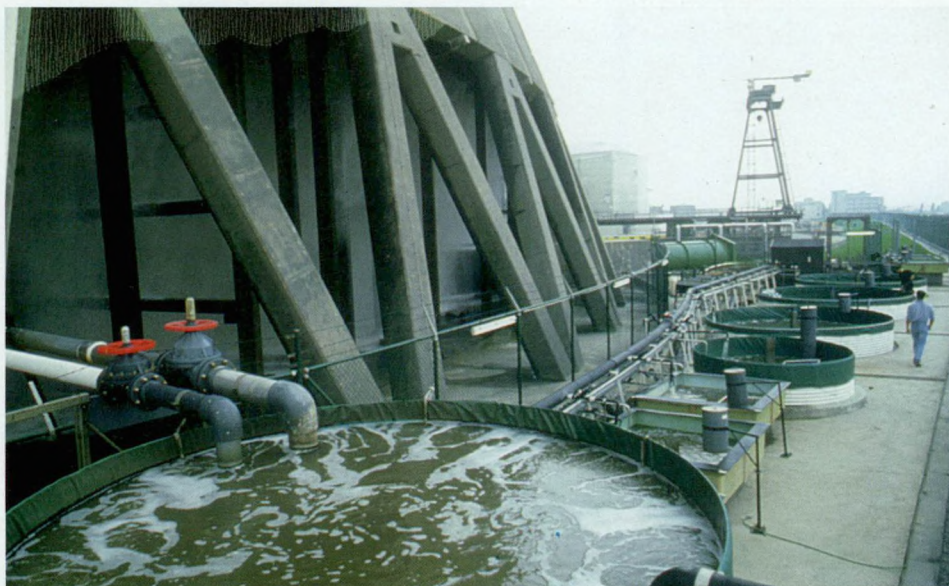
Experimentele proefinstallatie in de kerncentrale te Doel voor opkweek van zeebaars ( Dicentrarchus labrax ) en dorade ( Sparus aurata ).