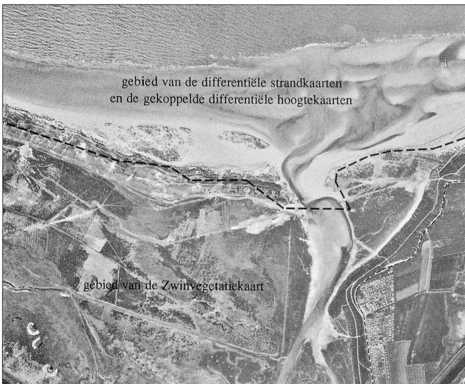
Fig. 1: Overzichtskarta van het Zwingebied.

Een van de opdrachten die aan het BEASAC meetplatform werden toevertrouwd, is het geregeld karteren van de vaargeulen, waaronder de Pas van het Zand, de toeganggeul tot de haven van Zeebrugge. Naast de genoemde eigenschappen van snelheid, wendbaarheid en nauwkeurige positionering, is een ander belangrijk voordeel van het BEASAC-platform, dat ook kan worden gelood in zeer ondiep water. Deze