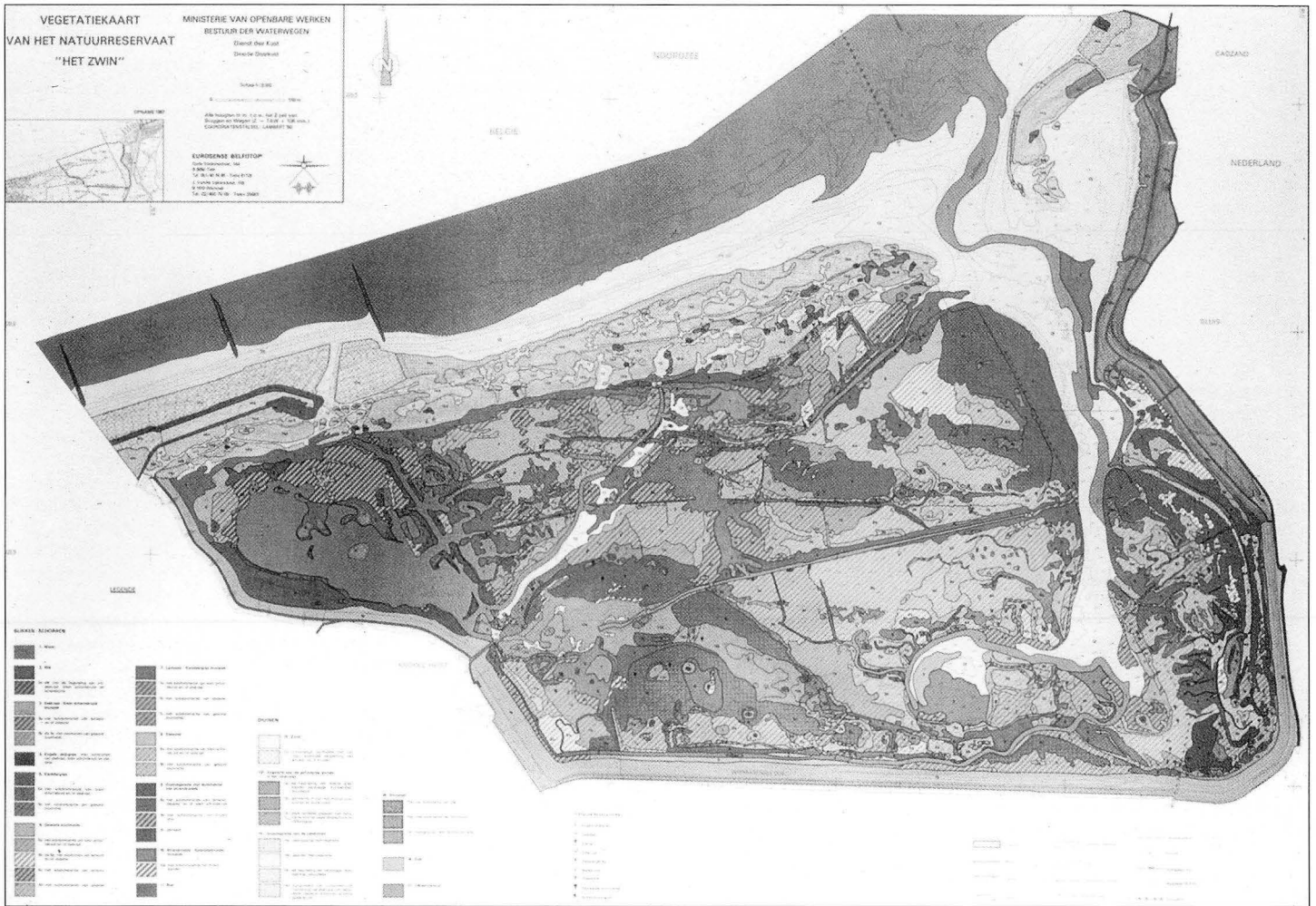
Tabel 1: Hoofdklassen in de legende van de Zwinvegetatiekaart.