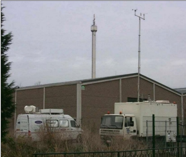
Fig.1. Lidar en mobiele meetwagen.