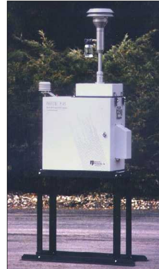
Fig. 2. Partisol-Plus toestel.

De pollutierozen voor PM10 stof, NO en NO 2 vertoonden pieken vanuit het oosten. Enkel voor SO 2 werden ook hogere concentraties vanuit het westen waargenomen. Dit is de richting van de industrie van Nord-Pas-de-Calais en Duinkerken.