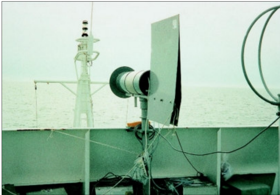
Fig. 4. Bemonstering van aërosolen aan boord van het oceanografisch schip RV Belgica.

Een eerste reeks campagnes werd georganiseerd op het oceanografisch onderzoeksschip RV Belgica. Aan boord werden luchtstalen genomen in de Belgische kustzone en Het Kanaal. Het betreft hier de Belgica ns 2198 campagne van 28 september tot 2 oktober 1998, de Belgica ns 1099 campagne van 19 april tot 23 april 1999 en de Belgica ns 1699 campagne van 29 juni tot 8 juli 1999.