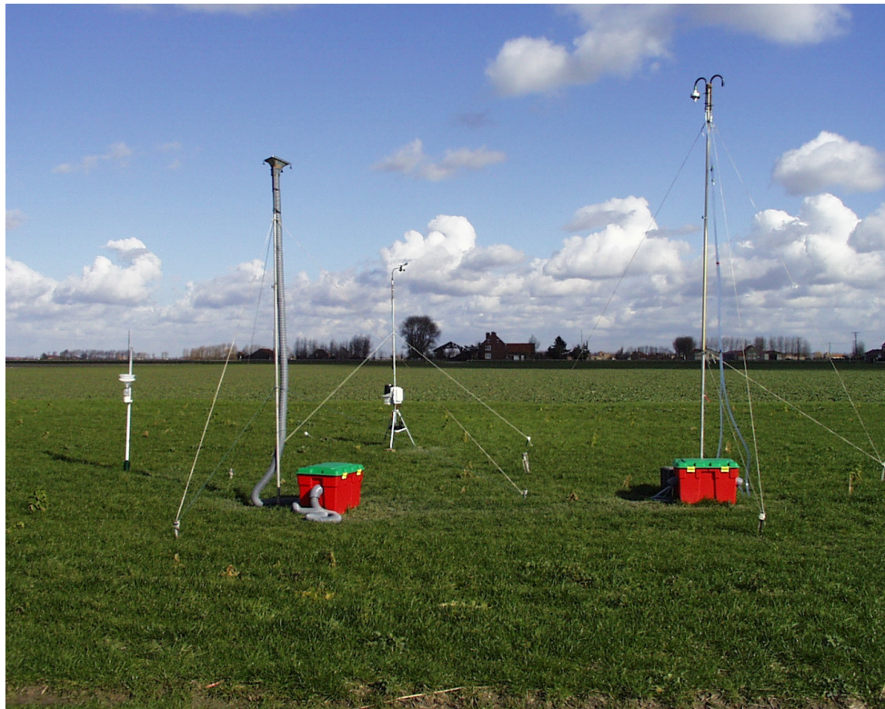
Fig. 3. Stalnamen aan de grond.

Het onderzoek van de metaalhoudende componenten te Duinkerken laat geen twijfel over de ligging van de emissiebronnen: de maximale gehalten aan Fe, Mn, Al, Ti, en Pb (respectievelijk ijzer, mangaan, aluminium, titanium en lood) kwamen voor bij W-NW winden, de sector waarin de voornaamste industrieën (staalindustrie, petrochemische industrie etc.) gevestigd zijn.