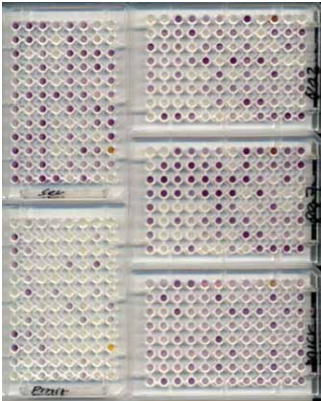
Figur 1. Biolog GN2-plater.

for mikrober, figur 1. Brønnene i mikrotiterplaten inneholder en tetrazoliumforbindelse og oksidasjon av brønnens substrat synliggjøres gjennom en samtidig reduksjon av denne forbindelsen til et lilla produkt. GN2 kan gi da et datarikt mål på det totale metabolske potensialet/ funksjonell-diversiteten til prøvens innhold av mikrober. GN2-plater er tidligere blitt brukt i strukturanalyser av komplekse mikrobielle populasjoner, blant annet vann (O'Connell et al., 2002, Stefanowicz, 2006).