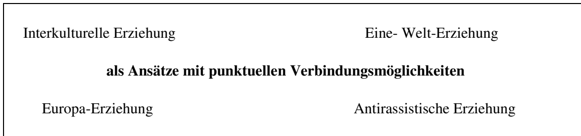
Abbildung 3: Punktuelle Zusammenführung der Ansätze Interkultureller Pädagogik

Für diese Form der Verbindung setzt sich beispielsweise Kiper (1996) ein. Sie plädiert dafür, Interkulturelle und Antirassistische Erziehung in der Grundschule begrifflich-theoretisch voneinander abzugrenzen und unterrichtlich-praktisch zusammenzuführen.