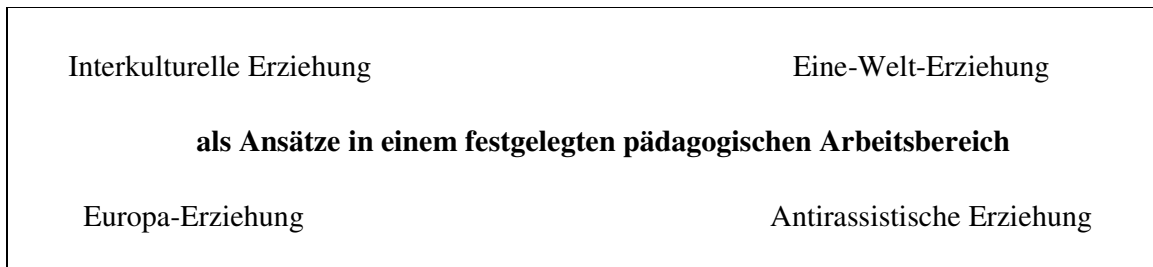
Abbildung 2: Arbeitsteilung zwischen den Ansätzen Interkultureller Pädagogik

Auernheimer beispielsweise befürwortet eine Verbindung der Ansätze der Interkulturellen und Antirassistischen Erziehung. Aufgrund der spezifischen Schwerpunkte sind sie seiner Auffassung nach allerdings nur für bestimmte Altersgruppen geeignet. Interkulturelles Lernen sollte im Elementarbereich und in der Grundschule, Antirassistische Bildung dagegen in den Sekundarstufen umgesetzt werden. Auernheimer kommt zu dem Schluss: