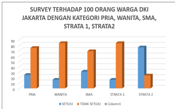
Gambar 2 Hasil Survei Penerapan ERP di DKI Jakarta

Gambar 2 di atas adalah gambar hasil survei terhadap 100 orang warga DKI Jakarta tentang penerapan ERP ( Electronic Road Price ) di DKI Jakarta. Pada gambar hasil survei di atas bisa disimpulkan bahwa mayoritas masyarakat tidak setuju atas Electronic Road Pricing (ERP) di DKI Jakarta, pro dan kontra biasa terjadi dalam sebuah kebijakan, semua pihak diharapkan bisa melihat positif akan kebijakan yang satu ini, karena setiap kebijakan diharapkan untuk memperbaiki sistem yang sudah ada dan diharapkan juga memperbaiki sistem yang sudah ada.