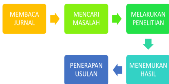
Gambar 1 Metodologi Penelitian 4MNP

Dalam memecahkan masalah di dalam penelitian ini, penulis menggunakan metode 4MNP yang diciptakan sendiri karena menurut penulis ini metode terbaik yang akan membantu penulis memecahkan masalah dalam sebuah penelitian yang akan di teliti sekarang, dengan metode 4MNP maka semua langkah penelitian akan dapat diselesaikan dengan mudah karena sudah menggunakan langkah yang terukur dengan baik, ada pun metode 4MNP dapat di lihat pada Gambar 1 di bawah ini: