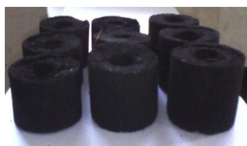
Gambar 1. Spesifikasi produk briket.

Hasil proses pembuatan briket arang dari bambu menggunakan alat pencetak hidrolik dengan dimensi berbentuk silinder berlubang, Diameter dalam (Di) 2 cm, Diameter luar (Do) 5 cm dan Tinggi 10 cm. Hasil yang didapat dapat ditunjukkan sebagaimana Gambar 1.