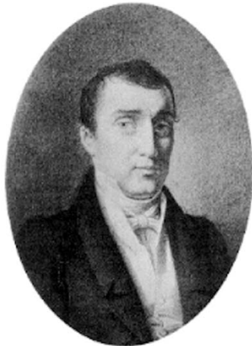
Слика 4. Портрет Сади Карноа из 1832. године.

на да се посвети проучавању рада парне машине. У то време у Енглеској је већ на стотине парних машина коришћено за различите намене као што су вађење воде из рудника, ковање гвожђа и упредање предива. Незадовољан својом војном каријером демобилише се 1828., и од тада се посвећује науци. Предузима далекосежна истраживања физичких особина гасова и пара, посебно њихових "еластичних истезања" (топлотних особина). Премореност је утицала на његово здравље. Јуна 1832., разбољева се од запаљења плућа праћено шарлахом. Још недовољно опорављен бива заражен колером која је харала Паризом и умире 24. августа 1832., у 36-тој години живота (слика 4). Опширнији биографички подаци о