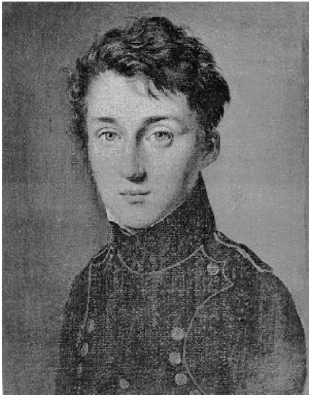
Слика 3. Портрет седамнаестогодишњег Сади Карноа у униформи Политехничке академије (1813. г.).

(Palais du Petit-Luxembourg) (слика 2), данас у склопу великог комплекса које н(и)оци назив Сенат, у којој су његов отац Лазар и мајка Софија живели док је Лазар био члан Директоријума (највишег тела извршне власти, који је трајао од 1795 до 1799. г). Име је добио по чувеном персијском песнику и филозофу Садију од Ширази (Saadi Abdullah Muslihuddin; 1184–1291). Лазар Карно се 1807., повлачи (се) из јавног живота 1 и посвећује својим научним истраживањима и образовању своја два сина које подучава математици, природним наукама као и језицима и музици. У лицеју Шарлемањ (Charlemagne) Сади се спрема за пријемни испит за Политехнику (Ecole Polytechnique) и 1812., са шеснаест година бива примљен. Ова знаменита школа је основана 1794., на иницијативу Лазара Карноа и Гаспара Монжа, који је био и један од њених директора. Октобра 1814., дипломира на Политехници као шести у Артиљеријској класи (слика 3). Од тада ради као војни инжењер селећи се