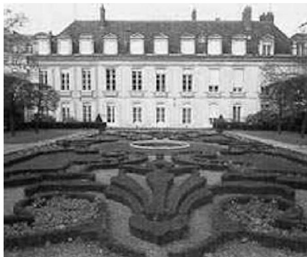
Слика 2. Савремени изглед Палате Мали Луксембург (Palais du Petit-Luxembourg) у којој је рођен Сади Карно.