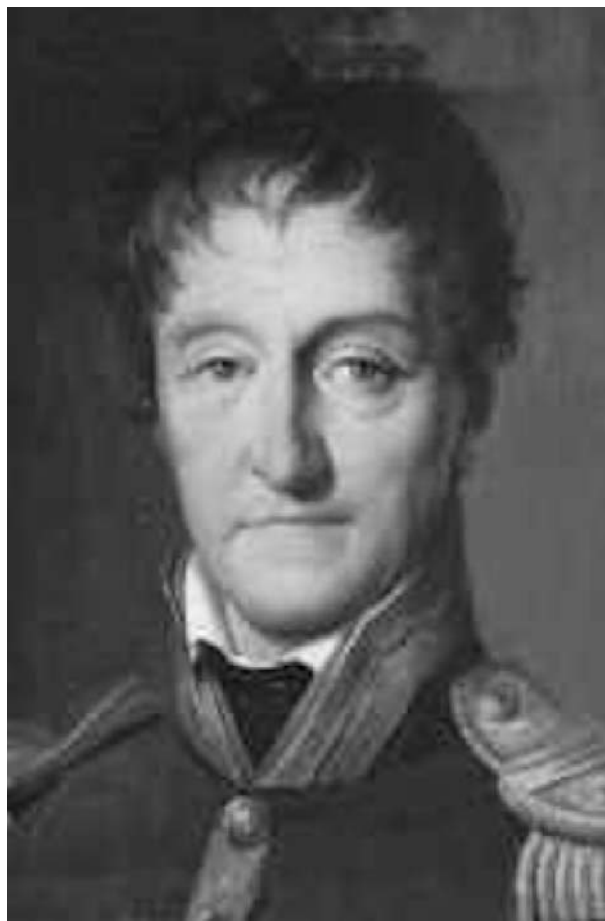
Слика 1. Лазар Карно, познат као "Организатор победе" и "Велики Карно", отац Сади Карноа.

Сади Карно (Nicolas Léonard Sadi Carnot) је рођен 1. јуна 1796. г., у Паризу у Палати Мали Луксембург