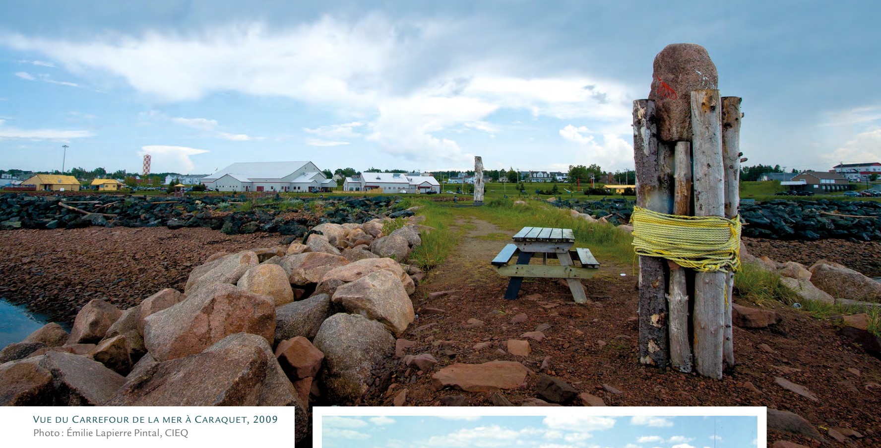
VUE DU CARREFOUR DE LA MER À CARAQUET, 2009

L'Acadie contemporaine se définit par sa démographie – le Nouveau-Brunswick en étant le pivot – et par son patrimoine maritime ou littoral, souvent mis en scène à travers l'offre touristique. C'est notamment le cas à Caraquet, auto-proclamée comme cœur de l'Acadie.