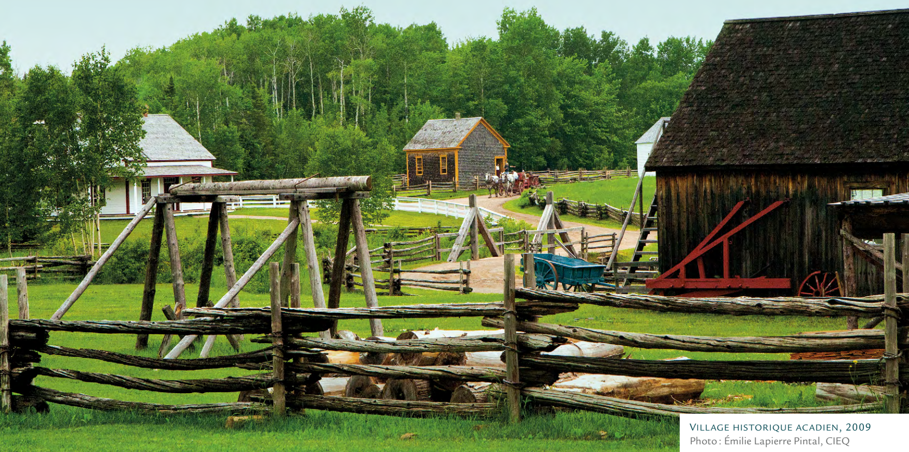
VILLAGE HISTORIQUE ACADIEN, 2009

des Brayons vers l'Acadie est le plus souvent le regard de l'Autre : l'Acadie, « c'est par en bas » dans les autres régions francophones de la province, soit le Sud-Est mais aussi... le Nord-Est ! Donc, tout laisse croire qu'il y a encore beaucoup d'autres Acadies à découvrir si l'on parle d'acadianité.