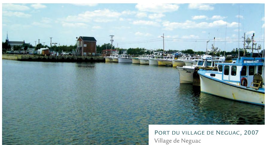
PORT DU VILLAGE DE NEGUAC, 2007 Village de Neguac

L'Acadie contemporaine se définit par sa démographie – le Nouveau-Brunswick en étant le pivot – et par son patrimoine maritime ou littoral, souvent mis en scène à travers l'offre touristique. C'est notamment le cas à Caraquet, auto-proclamée comme cœur de l'Acadie.