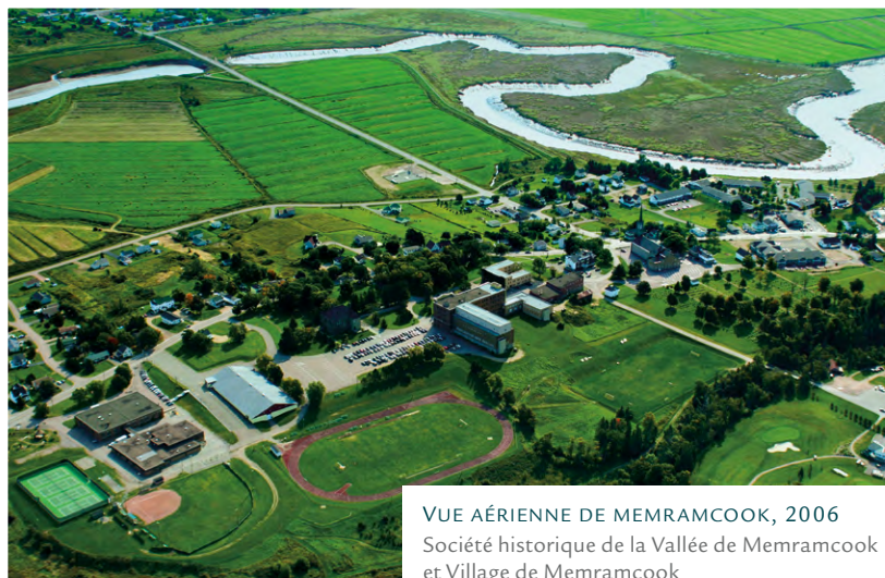
VUE AÉRIENNE DE MEMRAMCOOK, 2006

Les associations traditionnelles se transforment en associations provinciales officielles, financées par le gouvernement fédéral, et demeurent