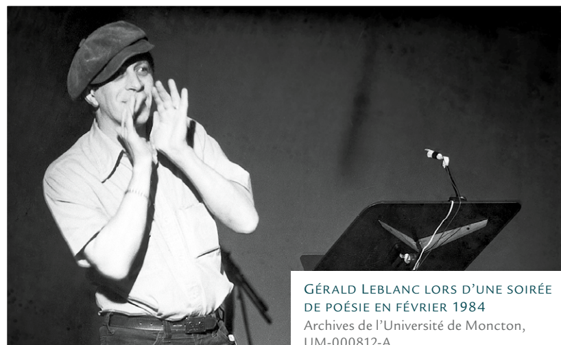
GÉRALD LEBLANC LORS D'UNE SOIRÉE DE POÉSIE EN FÉVRIER 1984

Gérald Leblanc, poète « phare » de l'Acadie, est né à Bouctouche dans le sud-est néo-brunswickois au cœur d'une Acadie dite « frileuse », c'est-à-dire qui vit, sans s'en réclamer, la culture « acadienne ».