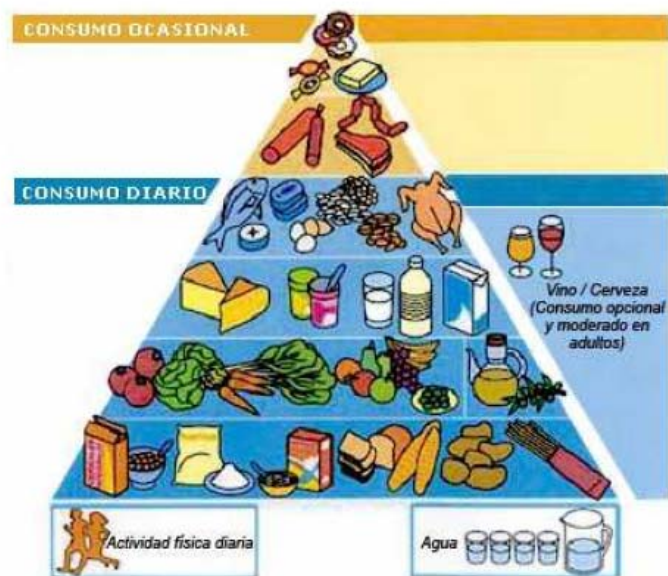
Figura 1. Pirámide de Alimentación Saludable (SENC 2004).

Integra los alimentos propios de la dieta española característicos de una dieta mediterránea. El cumplimiento de esta pirámide, en la que no falta la recomendación de mantener una actividad física diaria, e incluso refleja el consumo responsable y opcional de bebidas fermentadas de baja graduación como uno de los hábitos más arraigados en nuestra cultura gastronómica, podría suponer una herramienta adecuada para el mantenimiento de la salud y la prevención de la enfermedad.