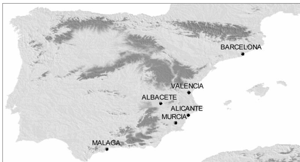
Fig. 1. Localización de los observatorios del litoral mediterráneo pertenecientes a la base de datos SDATS.

número de días/año en que se supera el percentil 90 de la temperatura mínima diaria); y noches frías (TN10, número de días/año en que no se supera el percentil 10 de la temperatura mínima diaria). Con objeto de examinar también el comportamiento de los episodios más extremos, se han calculado también los índices correspondientes a días y noches extremadamente cálidas o frías (TX98, TN98, TX02, TN02).