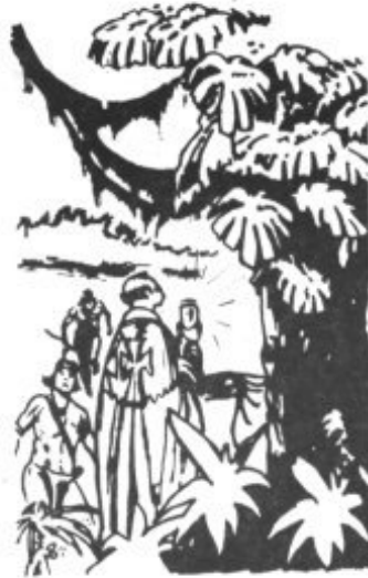
gráfico dedicado al fraile franciscano y misionero mallorquín.

Este centro de Estudios Teológicos de Mallorca que viene publicando interesantes escritos sobre su tema, quiso unirse al Bicentenario Serra publicando un número extraordinario y mono-