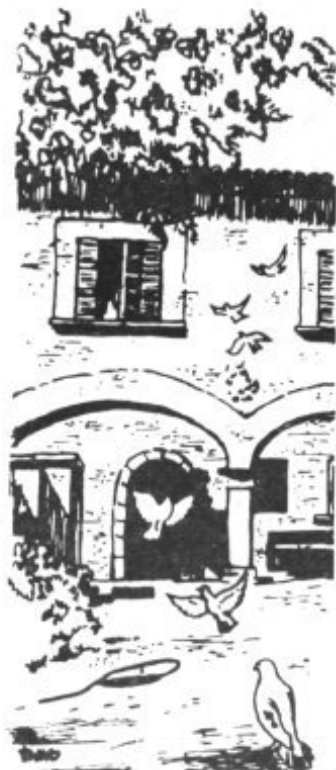
MUSEO FRAY JUNIPERO SERRA

causas naturales, sino a la intervención de él, ya sean los cuatro "prodigiosos" sobre los que se está investigando, u otros. Encaminadas a este fin son necesarias nuestras plegarias.