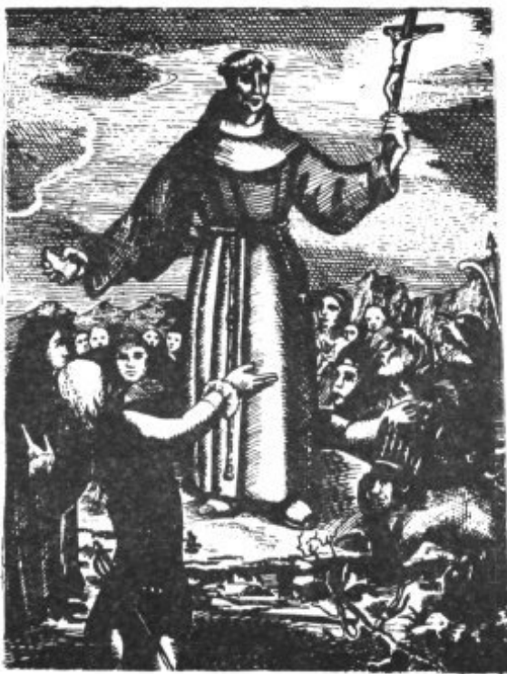
Grabado del siglo XVIII

El día 8 de Mayo de 1985, la "Sagrada Congregación para la Causa de los Santos", promulgó el Decreto por el que la Iglesia Católica declaraba como "Venerable" al Siervo de Dios Junípero Serra, sacerdote profeso de la Orden de Hermanos Menores, nacido en Petra (Mallorca) el 24 de noviembre de 1713 y muerto en el 28 de agosto de 1784 en Monterrey (California, U.S.A.) Por errores de transcripción se dió como fecha de nacimiento el 21 de noviembre de 1731. Felizmente coincidente es que la promulgación haya tenido efecto recién cumplido el bicentenario del fallecimiento del Padre Serra y cuando ya se han iniciado los preparativos para conmemorar el V Centenario del Descubrimiento y Evangelización de América.