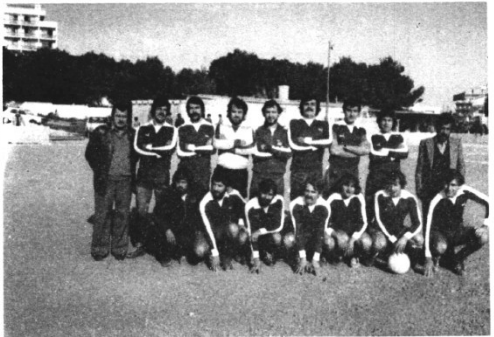
Actual equipo de fútbol de "Ca'n Picafort".

Pero, para ello, existen unas tremendas dificultades que amenazan, incluso, la continuidad del Club. La principal y al parecer insoslayable, es la casi imposibilidad de disponer de terreno de juego para la próxima temporada, pues el actual es de propiedad particular y sus dueños no pueden cederlo por más tiempo pues grava fuertemente sus intereses particulares.