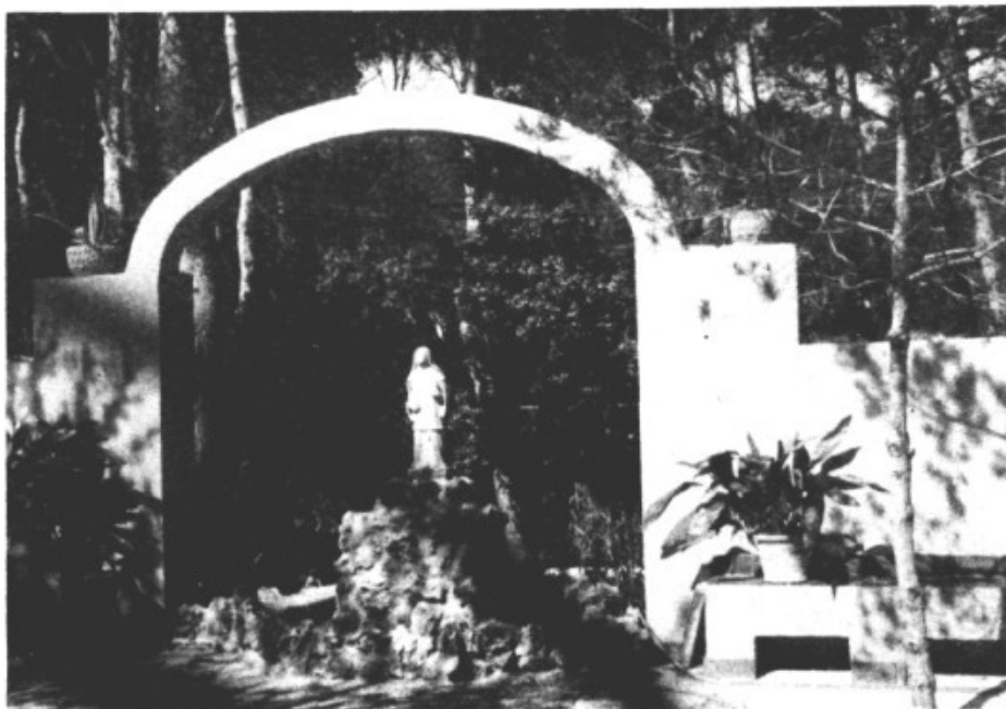
Vista parcial de la nueva "Iglesia-Jardín" de nuestra Parroquia. Imagen de la Beata.

Con fecha de 30 de Septiembre último se habían cubierto con la aportación de nuestros feligreses, 1.014.789 ptas. Falta a pagar todavía un déficit de 483.562 ptas., que esperamos alcanzar con otras aportaciones de nuestros amigos. A todos, nuestras gracias.