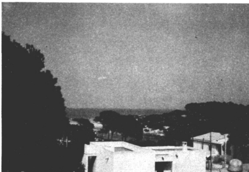
El innegable y ampliamente reconocido atractivo de Son Bauló quedará bien reflejado en esta panorámica del Torrente y la Playa.

Presidente de la Asociación de Propietarios y Vecinos de Son Bauló