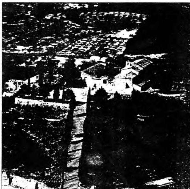
Vista aèria de Consolació