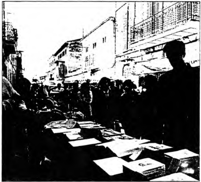
El Col·lectiu Teranyines treu les seves publicacions al carrer

A la primera convocatòria, el 20 de gener de 1942, el poeta D. Guillem Colom, a la claustra de l'antiga alqueria de Solanda, va fer la primera lectura pública del seu drama històric, avui encara inèdit, Cecília de Solanda ,