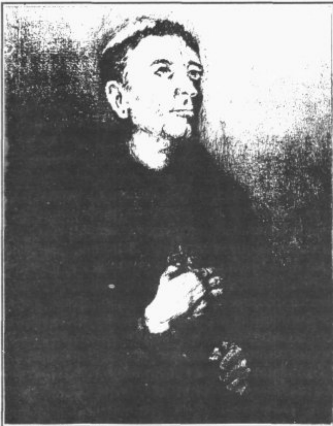
Fray Francisco Palou