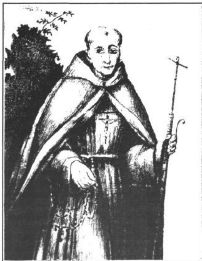
Venerable Fray Antonio Linás

Son nuestros misioneros, hombres que desplegaron sus cualidades en la compleja vida de evangelizar-civilizar y ante los problemas