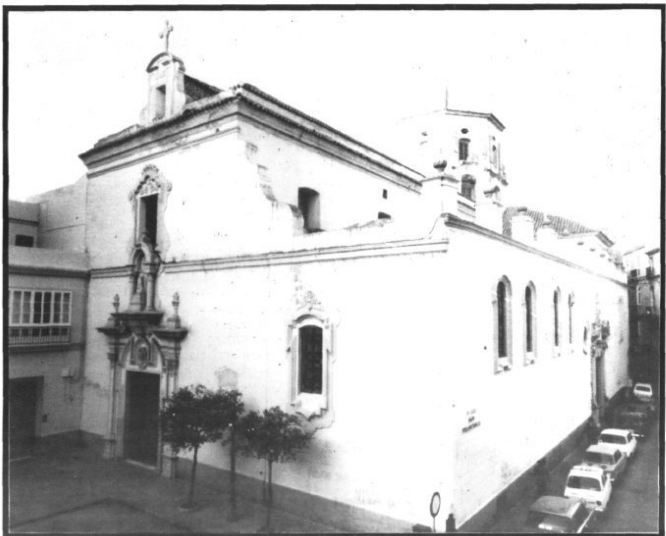
Iglesia de San Francisco de Cádiz, con la fachada del Convento al lado izquierdo de la foto. Aquí vivió Fray Junípero Serra, desde el 5 de mayo al 28 de agosto de 1749, en espera de embarcar hacia América.