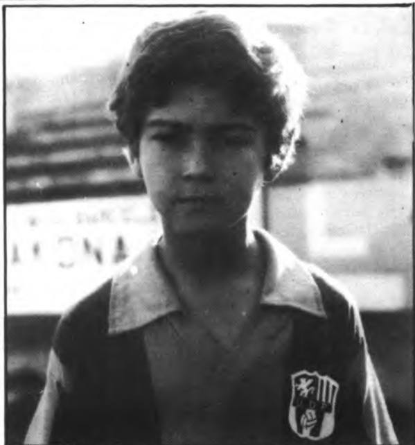
Canals, goleador y figura del Bejamín Poblense.