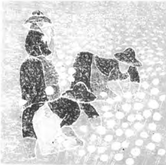
CASA DE CULTURA "SA NOSTRA" SA POBLA EXPOSICIÓN DE DIBUJOS, GRABADOS Y CERÁMICA

Del 27 de octubre al 13 de noviembre de 1983