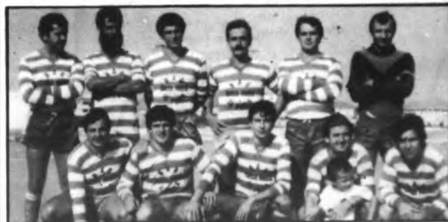
El Bar Miss, no da pie con bola.