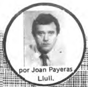
por Joan Payeras Lull.

Se trata de unas mejoras urgentes y necesarias que pueden concluir con la federación del campo y que permitirán el fomento de la práctica del atletismo en debidas condiciones.