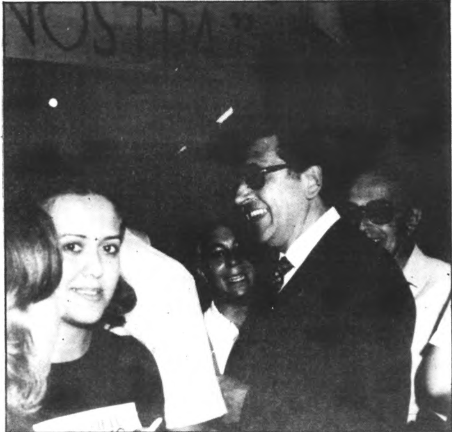
Albertí: una frontissa per vocació...

Per aquells lectors que no ho sàpiguen, direm que l'actual Parlament de les Illes Balears està format per 54 parlamentaris, 30 dels quals pertanyen a Mallorca i la resta a Menorca i Eivissa. La majoria parlamentària l'ostenten AP-PDL i UM, en virtut d'un pacte que va permetre la formació d'un Govern monocolor d'AP. En contrapartida, UM rebé la Presidència del Consell de Mallorca, organisme autò-