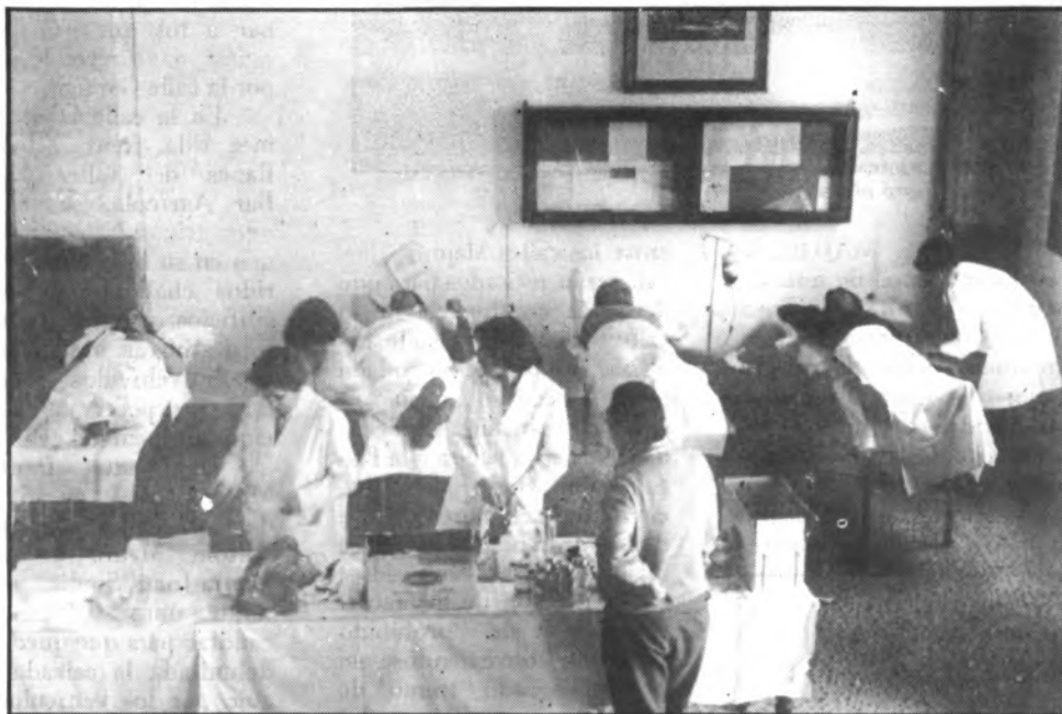
Sa Pobla necesita urgentemente el dispensario.