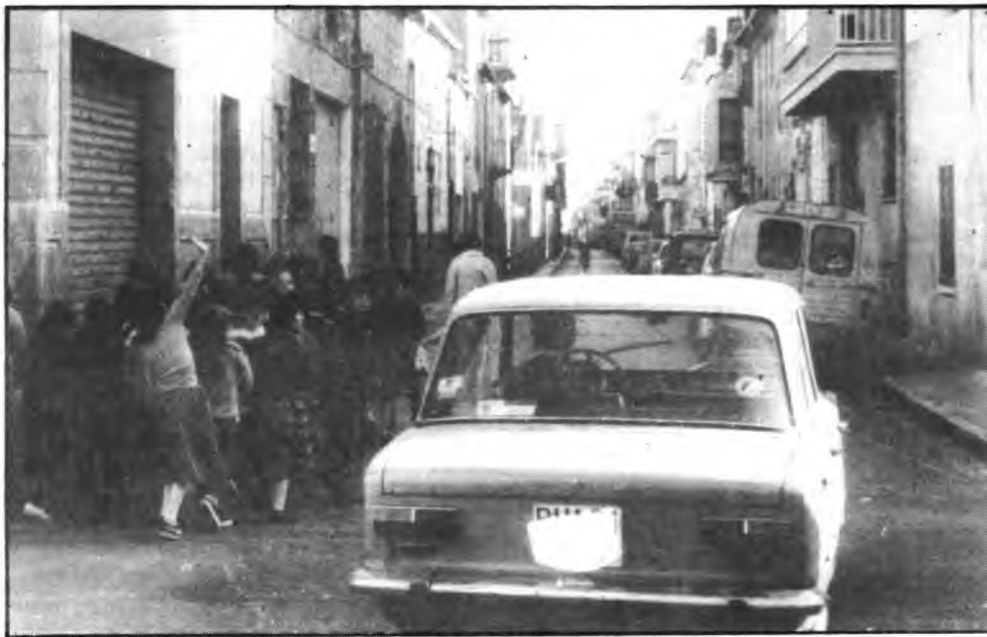
¿Se acabará el caos?

Varias e importantes mejoras se observarán en Sa Poble en materia de circulación y señalización de calles y distintos puntos de la población, según se desprende de la nota que nos ha sido facilitada por el Ayuntamiento y que damos a conocer a continuación: