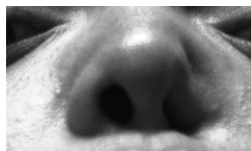
Fig. 1 y 2 Hundimiento del ala izquierda de la nariz

El diagnóstico exclusivamente radiológico no es posible, ya que los hallazgos son inespecíficos.