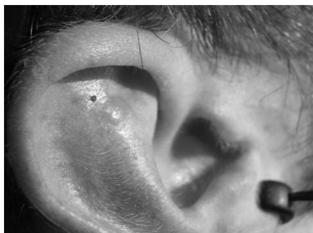
Figura 3. Pápula característica de leishmaniasis en la oreja de un joven.