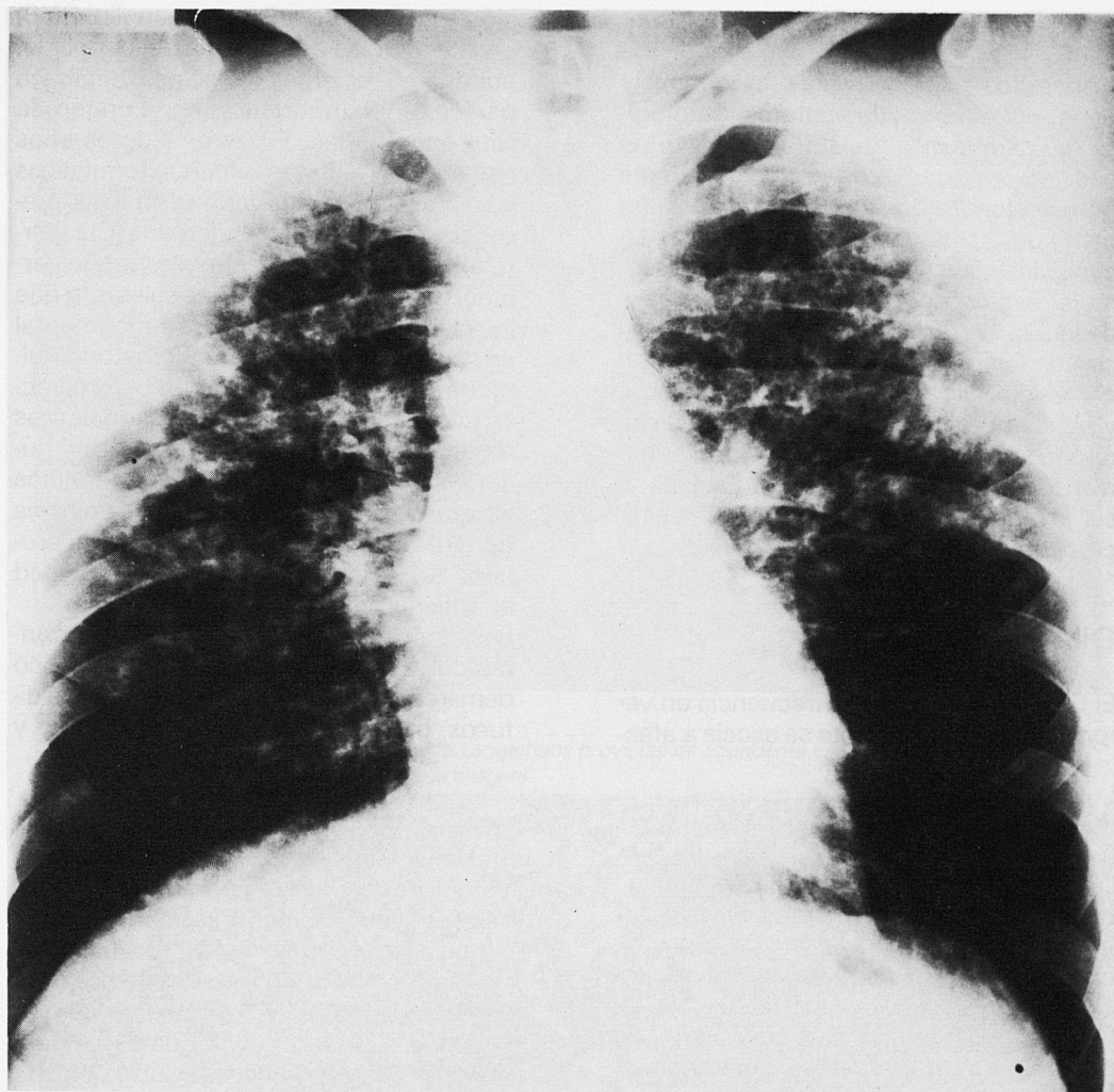
Figura 1 Radiografía P.A. Tórax. Enfermedad difusa bilateral de predominio en campos superiores con adenopatías hiliares, paratraqueales derechas y ventana aorto pulmonar.

respiratorias: negativas. BAAR y cultivo de Lowenstein del esputo: negativos. Ca^{++} : normal. Enzima conversor de la angiotensina (ECA): 526 (normal de 115-419). Inmunoglobulinas, autoanticuerpos, complemento e inmunocomplejos: normales. Latex: (-). Prot. C reactiva: (+). Broncofibroscopia: normal, microbiología del broncoaspirado (BAS): (-); Citología del BAS: frotis inflamatorio leve; Lavado broncoalveolar (BAL): eosinófilos (11%), neutrófi-