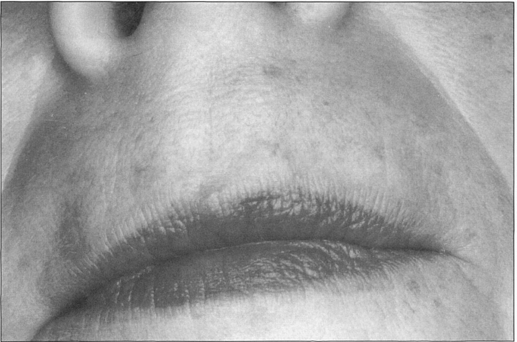
Fig. 3. Queratosis actínica antes y después del tratamiento con rayo de Láser CO2 superpulsado a intervalos de 0,2 segundos. Potencia empleada 2,6 J/cm2.