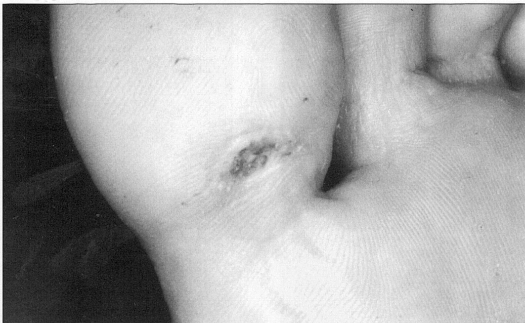
Fig. 4. Verruga vírica plantar, rebelde a todo tratamiento y de varios años de evolución. Aspecto a los cinco días de cirugía con Láser de CO 2 ; rápida cicatrización y buena evolución. Recidiva menor que con otros tratamientos.