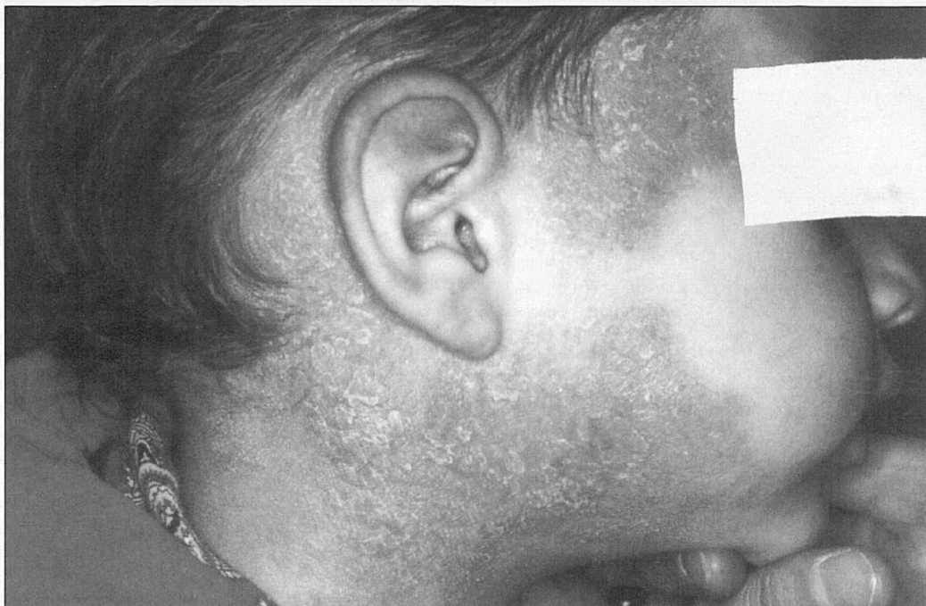
Fig. 5. Niño con angioma plano facial en tratamiento con Láser Candela en centro hospitalario. Tras la tercera sesión y transcurridas varias semanas sufre dermatitis inflamatoria inexplicable que altera los buenos resultados estéticos iniciales.