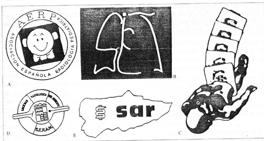
LOGOTIPOS DE FILIALES A: Filial de Radiología Pediátrica. B: Filial de Imagen Torácica. C: Filial de Ultrasonografía Diagnóstica. D: Filial Radiológica del Sureste. E: Filial Asturiana de Radiología.