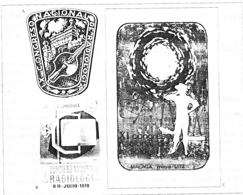
CARTELES Y LOGOTIPOS DE CONGRESOS NACIONALES (II) A: IX Congreso Nacional, Zaragoza 1968. B: X Congreso Nacional, Santiago 1970. C: XI Congreso Nacional, Málaga 1972.