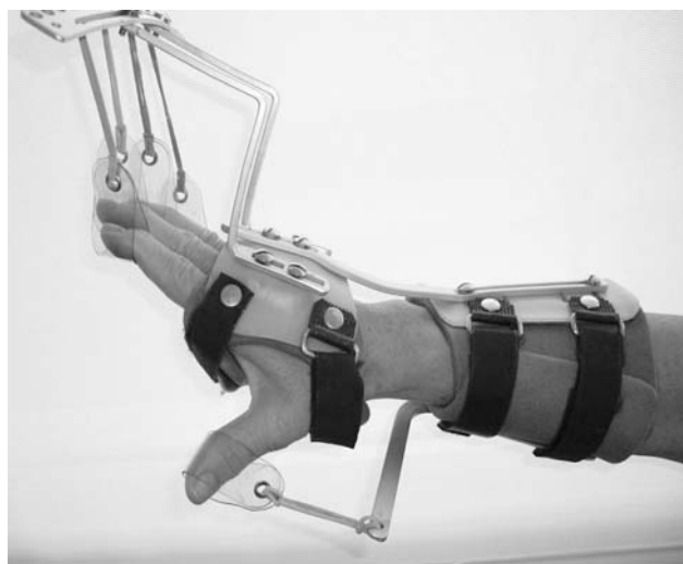
Figura 5.-Férula dinámica de Thomas.

A los 6 meses, el balance muscular es: extensión del carpo y del pulgar 3-/5; extensión propios de 2º y 5º a 2+/5. Molestias por dificultad a escritura y actividades manuales finas.