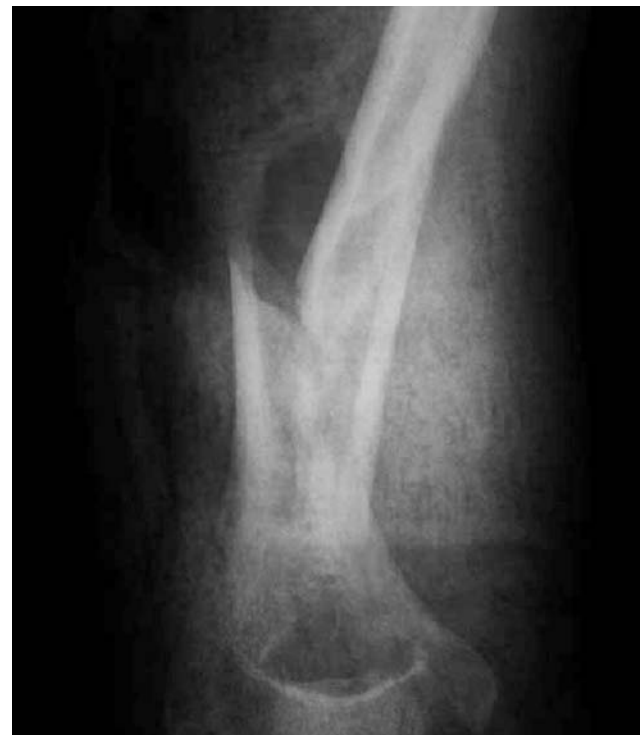
Figuras 1 y 2.- Foco fractuario preoperatorio con férula de yeso neutralizadora.