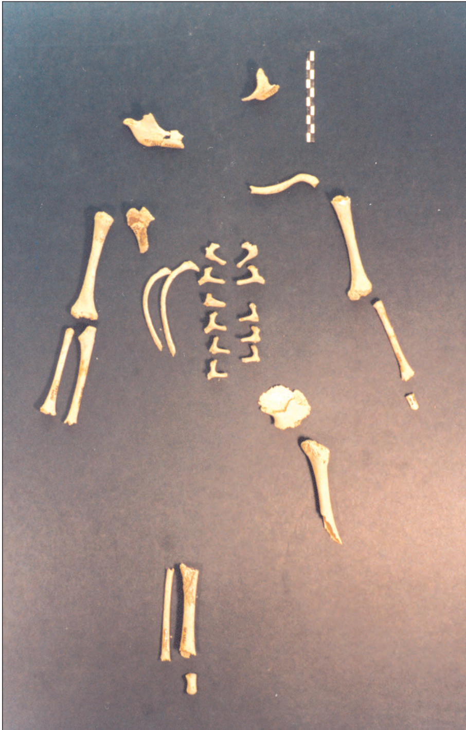
Figura 3. Individu procedent del contenidor ceràmic amb número de conjunt 158.