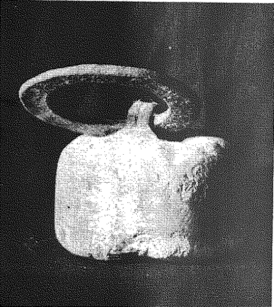
Pesa de piedra con su argolla metálica.