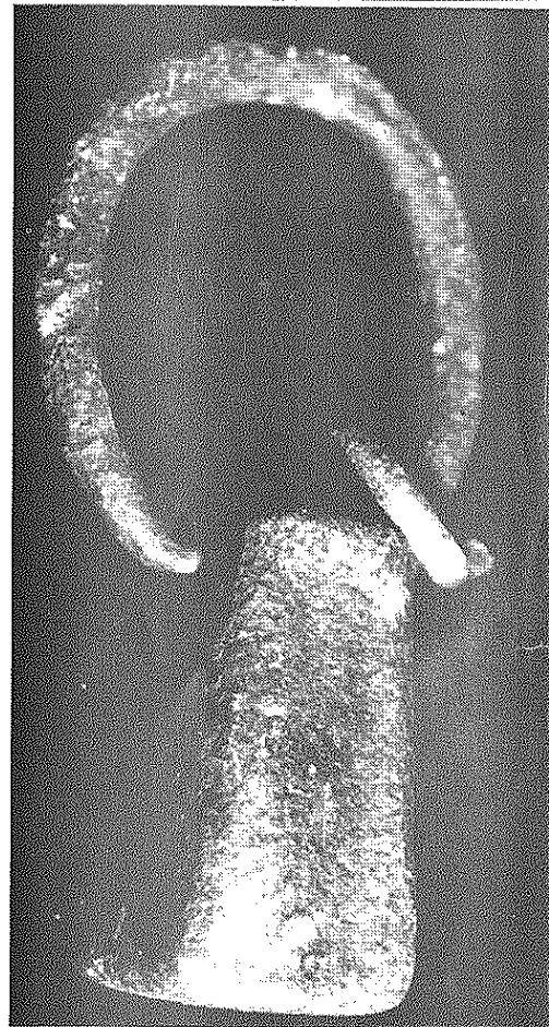
Pesa metálica con el asa correspondiente (Museo de Mallorca).