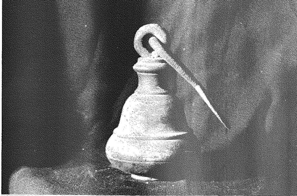
Contrapeso metálico usado en las romanas.