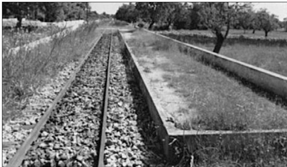
Disposava d'un petit baixador o andana d'uns 25 metres aproximadament!

El baixador del tren és l'exponent que indica la potència econòmica de la zona de Tirasset. Aquesta andana o baixador fou construït a final dels anys 40, va desaparèixer amb motiu de les obres de construcció per la reobertura de la línia de ferrocarril Inca-sa Pobla, el desembre de l'any 2000. Es trobava situat entre l'estació de Son Bordils o enllaç i l'estació de Llubí. Estava destinat a donar servei a l'escola rural i a un nucli dispers de cases de la zona de Tirasset Vell, Son Arnau, Can Colau, Son Fillol, Can Pobres Vell, Tirasset Nou, Can Salat i Son Alegre, entre altres. Aquesta zona era eminentment agrícola i ramadera, d'aquí que es construís l'andana.