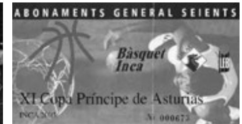
Figura 2. Subcampió de la Copa Príncep d'Astúries, any 1998.