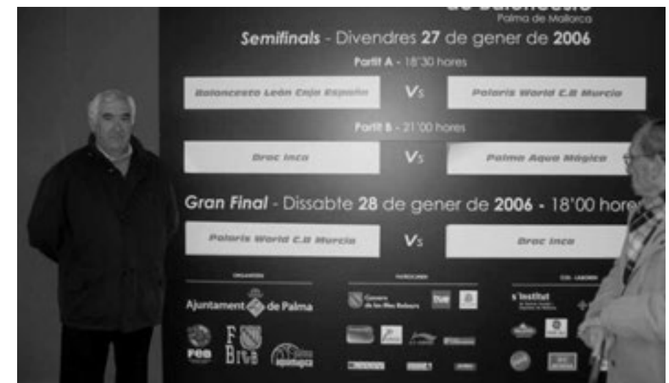
Figura 4. Cartell de la Copa de la temporada 2005-2006.