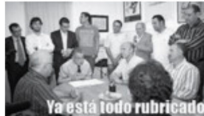
Figura 11. Moment de la creació del Club Bàsquet Mallorquí.