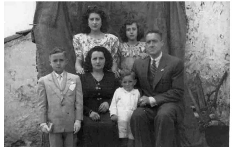
A l'esquerra de la imatge, vestit de primera comunió