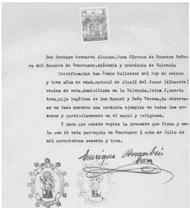
Certificat de bona conducta expedit pel capellà de Benetússer