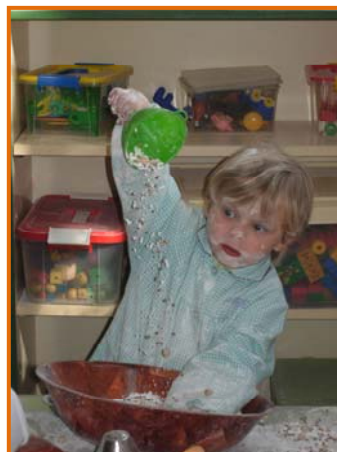
Figura 5. Fillet jugant amb farina i llavors.

Volem garantir espais i temps perquè els infants puguin gaudir d'un diàleg enriquidor entre ells o amb l'adult, a