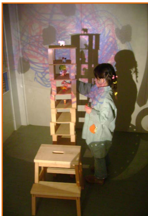
Figura 30. Vista de la màgia de la sala.