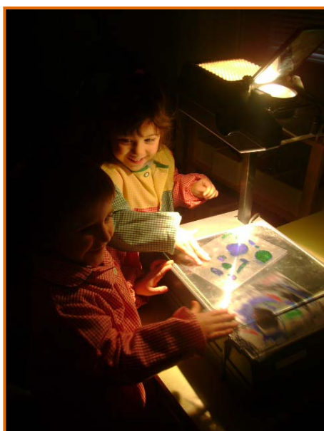
Figura 14. Fillets construït a la sala de llum i construccions (2).

Potenciem aquí la creació i recreació plàstica amb les ombres, colors i llum; d'aquesta manera es forma un quadre visual molt ampli i ric.