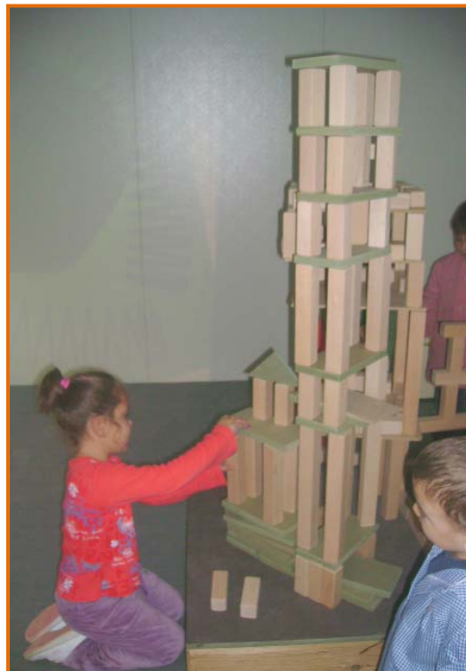
Figura 13. Fillets construint a la sala de llum i construccions (2).