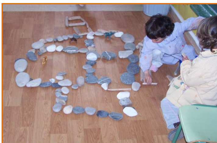
Figura 2. Racó de les pedres.