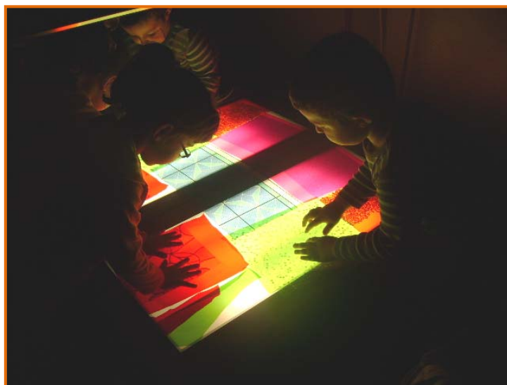
Figura 16. La màgia dels colors i la llum.

Els fillets i filletes es deixen seduir per la màgia de la llum i l'ombra, i a partir d'aquí sorgeixen històries i jocs espontanis en els quals no s'amaguen l'observació, la comunicació i l'emoció.