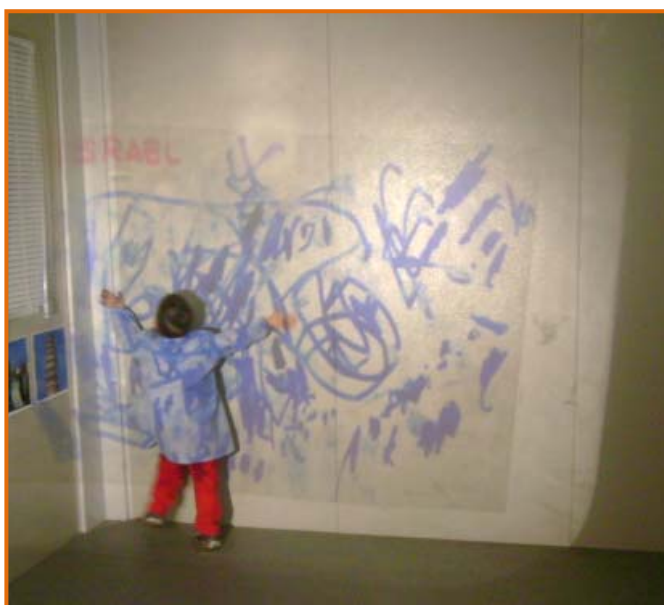
Figura 15. Immersió dins del dibuix.