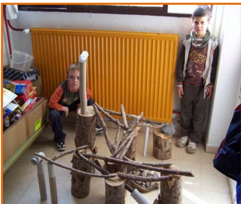
Figura 9. Racó de troncs.

Sabem que el veritable aprenentatge no es fa en un paper. L'infant ha de provar, ha de tocar, manipular, equivocar-se, moure's... La qualitat de l'aprenentatge radica en el procés i no en el resultat final