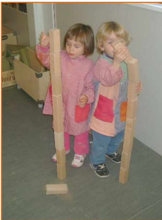
Figura 27. Les primeres construccions.