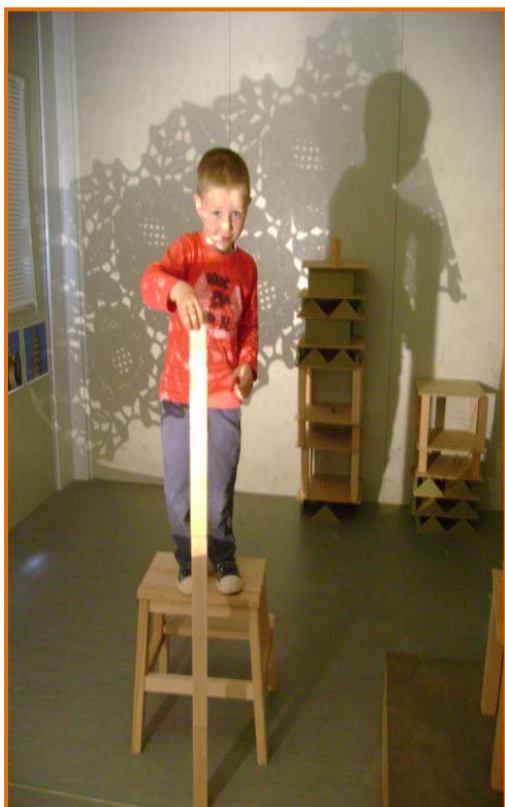
Figura 19. Exercici de concentració.

A la sala construïm un context que té relació amb un tipus d'aprenentatge que volem afavorir. Pensem que aquests s'han de basar en les relacions personals, en les actuacions espontànies, en l'aplicació autònoma d'estratègies diverses, d'imitacions, experimentació, comunicació i mobilització conscient i inconscient de significats. La cooperació, més que mai, és una estratègia reina amb la qual s'ha de treballar.