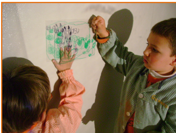
Figura 24. Fillets treballant amb transparències.