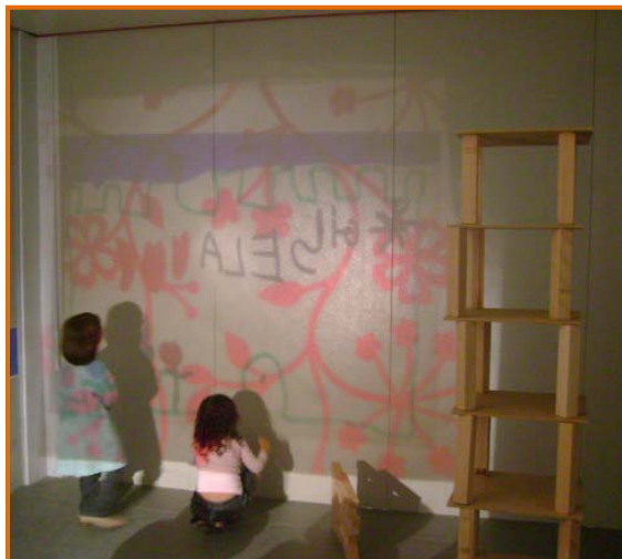
Figura 29. Filletes admirant la seva obra.