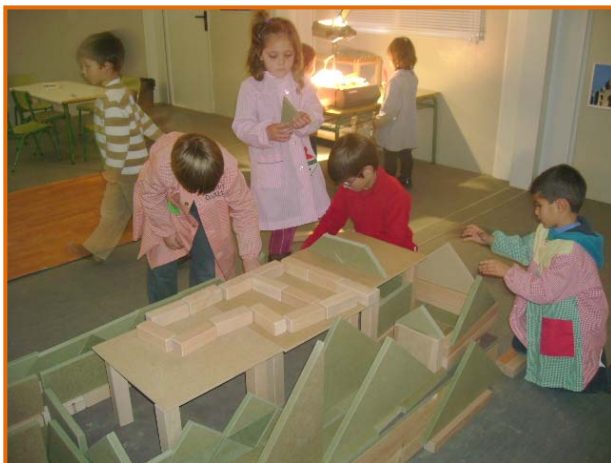
Figura 26. Fillets i filletes construint un vaixell pirata.