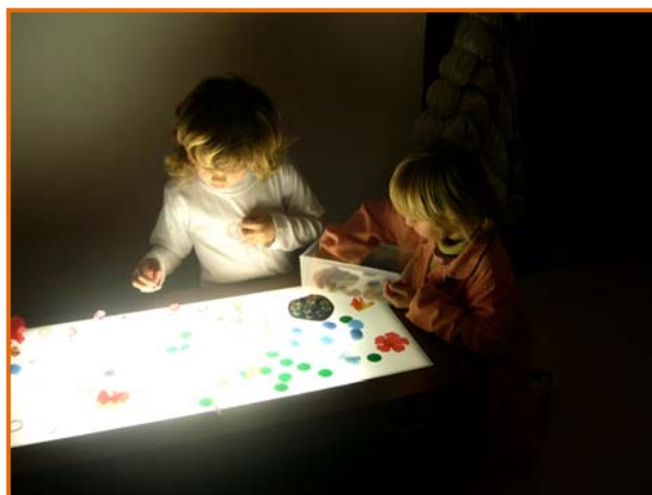
Figura 12. Filletes construint a la sala de llum i construccions (1).