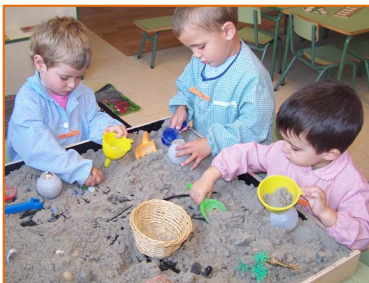
Figura 1. Fillets jugant al racó de l'arena.

Vam començar en una escola d'estiu, a l'agost de 2006, del Moviment de Renovació Pedagògica de Menorca, on vam assistir al curs de Meritxell Bonàs, amb el títol: L'estètica a educació infantil. A partir d'aquí i amb l'interès que ens va despertar aquell curs, vam iniciar alguns intercanvis entre mestres de diferents escoles de Menorca, que en àmbit informal ens interessàvem pels espais educatius dels centres, materials i algunes iniciatives dutes a terme. També vam organitzar un viatge i vam visitar