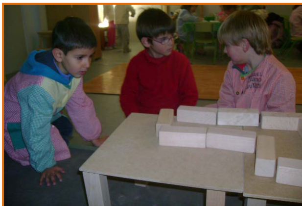
Figura 18. Fillets pactant una construcció.

Volem que sigui un espai més de vivència, dins el conjunt de vivències escolars. Amb aquest projecte intentem fer una recerca de com els infants es construeixen autònomament com a subjectes. En concret, la recerca de bellesa per part d'ells forma part també dels processos autònoms de pensament.