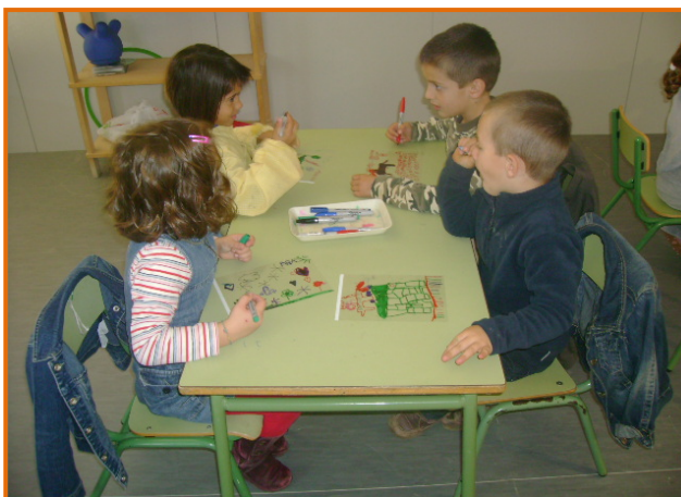
Figura 21. Fillets i filletes dibuixant per projectar.