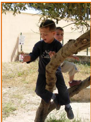
Figura 6. Joc lliure al pati.