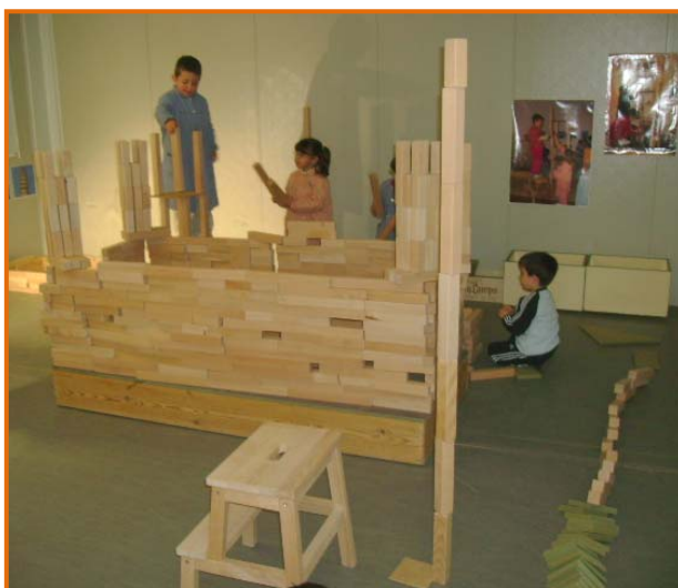
Figura 25. Fillets i filletes col·laborant en un projecte comú.