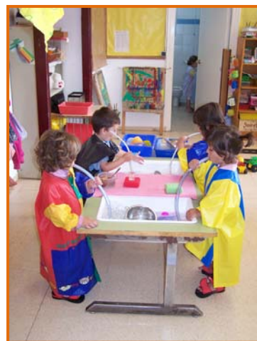
Figura 8. Fillets experimentant amb l'aigua.

Sabem que el veritable aprenentatge no es fa en un paper. L'infant ha de provar, ha de tocar, manipular, equivocar-se, moure's... La qualitat de l'aprenentatge radica en el procés i no en el resultat final