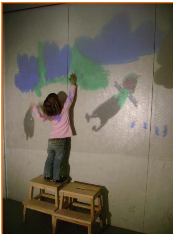
Figura 28. Filleta tocant el cel.