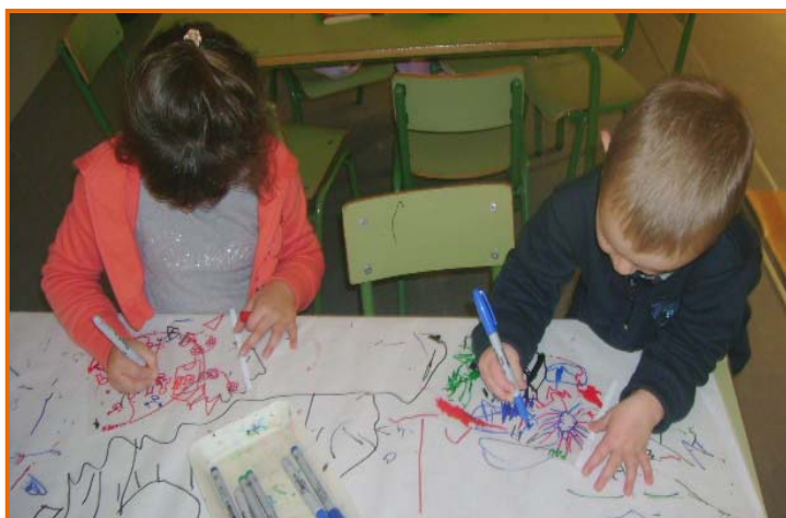
Figura 17. Racó de representació a la sala de llum i construccions.