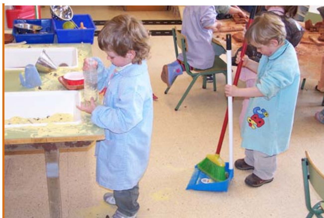
Figura 4. Racó de la farina de blat.

partir de la seva manera d'estar i de les seves accions transformadores.