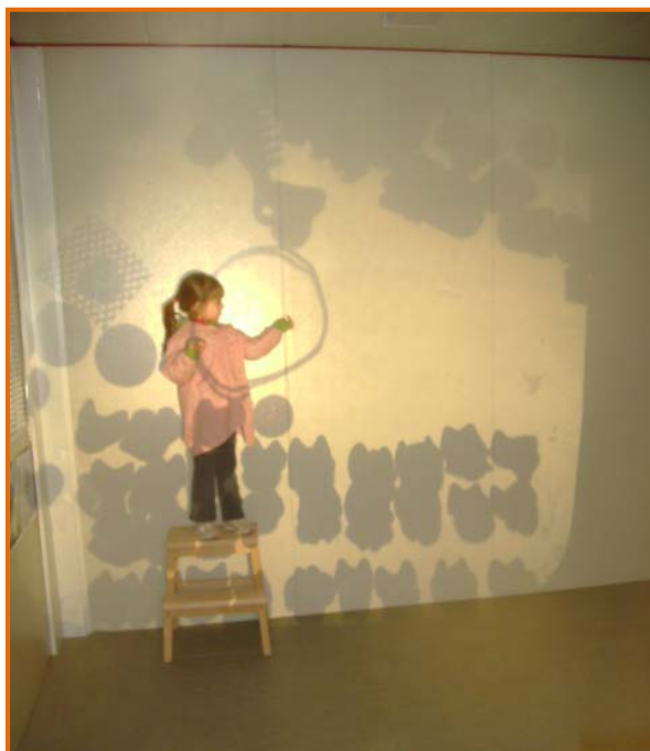
Figura 23. Filleta compartint la creació amb la classe.