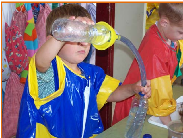
Figura 3. Racó de l'aigua.