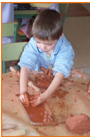
Figura 7. Racó de fang.