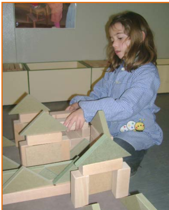
Figura 22. Filleta construint.