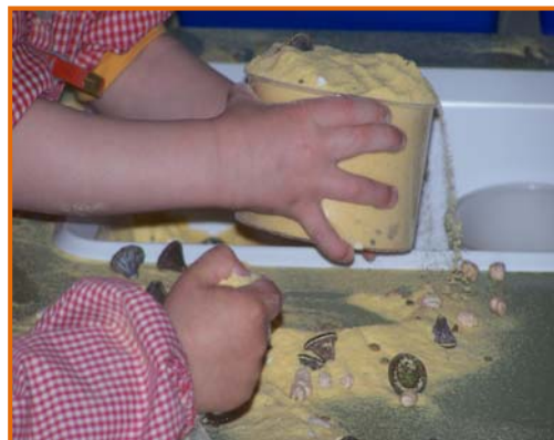
Figura 10. Maneig de farina de blat d'indi i llavors.