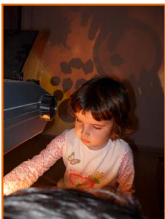
Figura 11. Filleta jugant amb el retroprojector a la sala de llum i construccions.

Un espai que hem anomenat "Sala de llum i construccions".