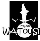
Fig 8. Logotipus del WATouSI Project

El projecte s'anomena WATouSI Project i el cercador de planes web està disponible a http://www.ehib.es/watousi