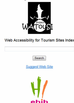
Fig 13. Plana principal del cercador de planes web del WATouSI Project

Amb la base de dades s'ha decidit fer un cercador de planes web confeccionant la llista de resultats ordenada segons els nivells d'accessibilitat, donant prioritat als nivells d'accessibilitat que corresponen a la norma de la WCAG 2.0.