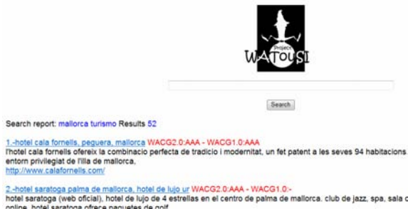
Fig 14. Plana web de resultats que dona el WATouSI Project

Una vegada que s'han introduït les paraules clau es pot fer clic a Search per poder veure els resultats