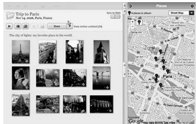
Figura 3. Exemple d'un servei «Geotagged Content Making» de Google Maps

Un exemple és la xarxa social Foursquare que ja compta amb molts d'usuaris registrats a Amèrica.