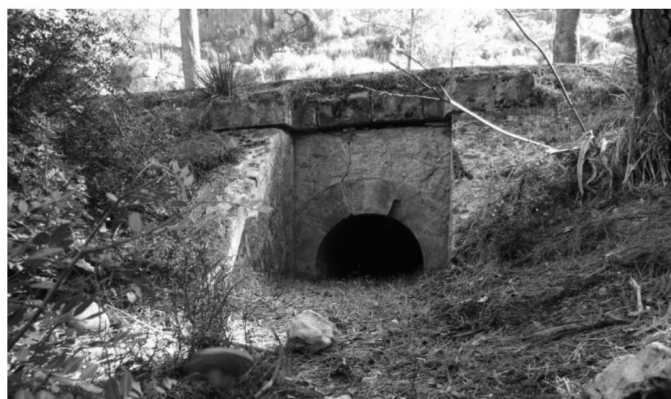
Fig. 5. Sortida d'un drenatge transversal.