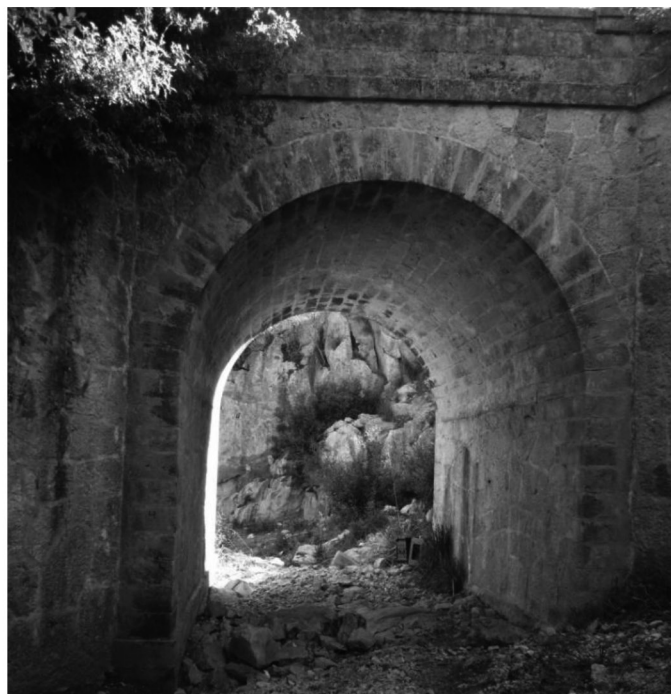
Fig. 6. Pont per salvar un petit torrent.