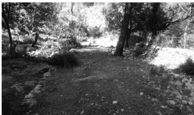
Fig. 1. Tram del camí antic que pujava a Lluc.

Estada comenta que, fins aquell moment, la majoria del camí es trobava sense estudiar, tot i que estava habilitat per al trànsit públic, excepte en un tram entre Lluc i Caimari que era massa abrupte per ser aprofitat per transports sobre rodes. Aquest fet dificultava en gran mesura les comunicacions de la zona.