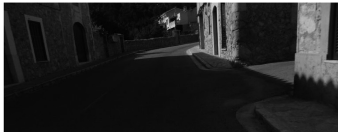
Fig. 4. Estat actual de la travessia de Caimari.

Vegem una sèrie d'imatges de la carretera actual: