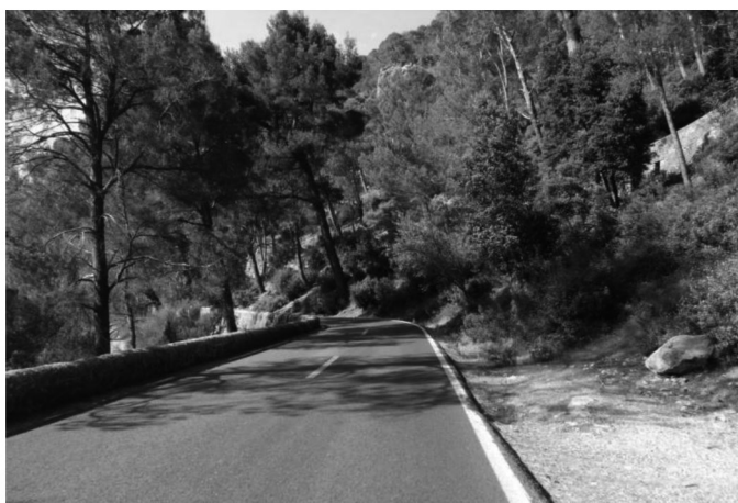
Fig. 7. Tram amb mur de contenció de pedra calcària.