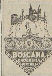
Photo-Laborium, Photozubehoer Kunstmalerbedarf, Rembrandt-Talens und Winsorfarben.