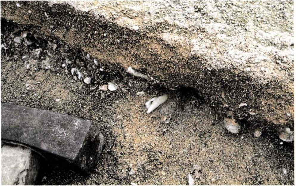
Fig. 2. En el centro de la fotografía se puede observar el hueso de Phalacrocorax aristotelis en los sedimentos de playa del subestadio isotópico 5e, cerca de la Cova des Coloms (Canteras de Sa Fossa, Lluçmajor).

Fig. 2. In the centre of the photograph the fossil remains of Phalacrocorax aristotelis , embedded in the beachrock deposits from the Isotopic Substage 5e. The deposit is very near the cave of Coloms "Pigeon Cave" (Quarry of Sa Fossa, Lluçmajor).