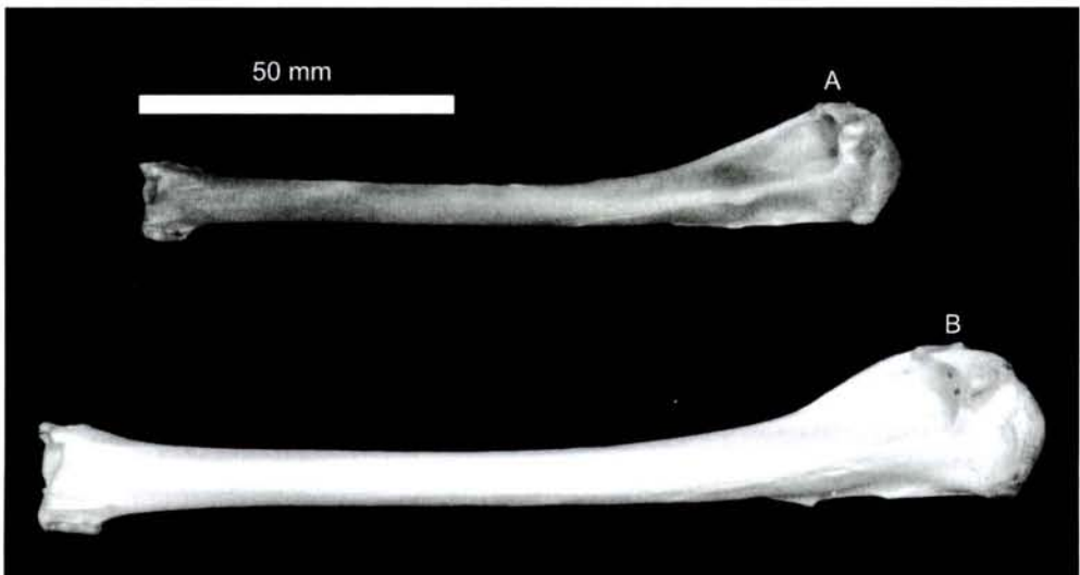
Fig. 4. Húmero en su aspecto caudal de P. aristotelis (A) y P. carbo (B). Escala 50 mm. Fig. 4. Caudal surface of the extant humerus of P. aristotelis (A) and P. carbo (B). Scale 50 mm.

El Cormorán Moñudo ha sido hallado en diversos yacimientos arqueológicos y paleontológicos del Pleistoceno superior de todo el continente europeo y mediterráneo. En las islas mediterráneas, el Cormorán moñudo ha sido hallado en varios yacimientos paleontológicos prehumanos: Cerdeña, Córcega y Creta (Alcover et al. , 1992). En la península Ibérica se conoce restos procedentes de varios yacimientos paleontológicos y arqueológicos: Gibraltar; Castro do Zambujal, Portugal; Xàtiva, Valencia (Hernández Carrasquilla 1993). Restos fósiles de Cormorán moñudo se conocen en tres yacimientos paleontológicos de las Baleares: Cova Nova de Capdepera, Mallorca - Pleistoceno superior (Florit y Alcover, 1987a; 1987b); Cova del Mirador de la Costa dels Pins, Son Servera, Mallorca - Pleistoceno (Mourer-Chauviré et al. , 1977);