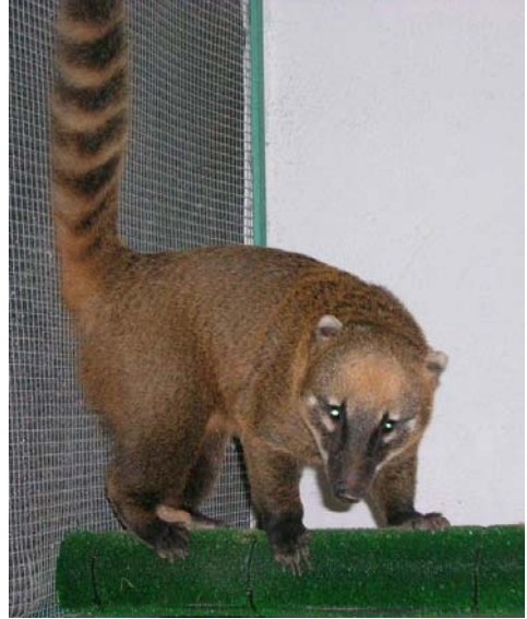
Fig. 1. Exempler de coatí, Nasua nasua L.

El Coatí, Nasua nasua (L. 1766), conegut també com a pizote o pisote , és un carnívor diürn centre i sud-americà, de la família Procyonidae, de talla mitja (de 76 a 104 cm de longitud i pes mig de 4,5 kg.) color roig terrós, amb conspicües bandes