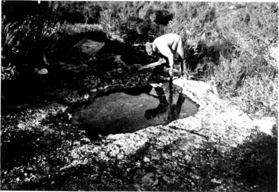
Abbildung 1: Felswannentümpel im trockenen Ödland Mallorcas mit zahlreichen Larven von Bufo viridis .

Rufende Kröten wurden in einem künstlich angelegten, nur flach mit Wasser gefüllten Weiher in einer kleinen Anlage angetroffen, Larven in einem kleinen, wannenartig in den Fels eingetieften Tümpel mit ziemlich dichtem Pflanzenbewuchs, dessen Wasservolumen zwischen 1 und 2 m 3 liegen sollte (Abb. 1). Die Wassertemperatur lag dort bei 19° C, pH um 6,5 – 7,